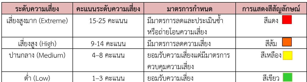
ตารางระดับของความเสี่ยง (Degree of Risk)

ซึ่งจัดแบ่งเป็น 4 ระดับสามารถแสดงเป็น Risk Profile แบ่งพื้นที่เป็น 4 ส่วน (4 Quadrant) ใช้เกณฑ์ในการจัดแบ่งดังนี้