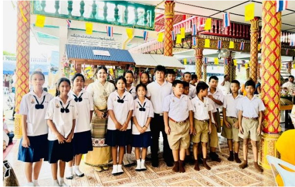
ถวายเทียนพรรษา