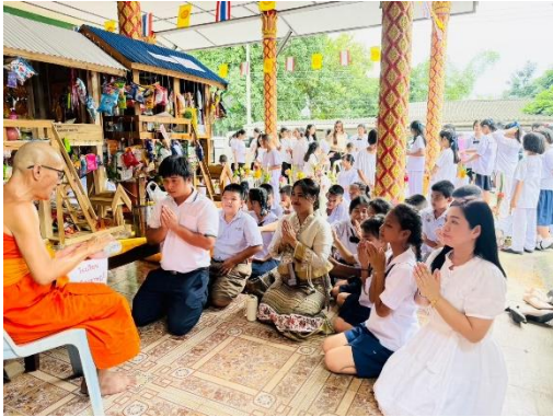
ทานก๋วยสลาก