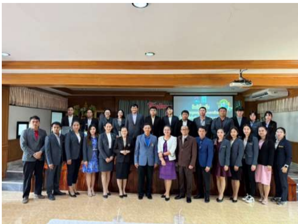
ศึกษาตุงานที่โรงเรียนหนองหินวิทยาคม อำเภอหนองหิน จังหวัดเลย