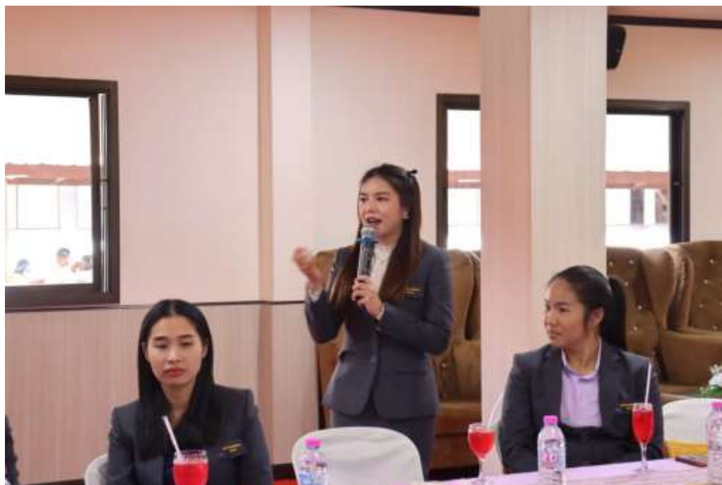
ศึกษาดูงานที่โรงเรียนเซิมพิทยาคม อำเภอโพธาราม จังหวัดหนองคาย