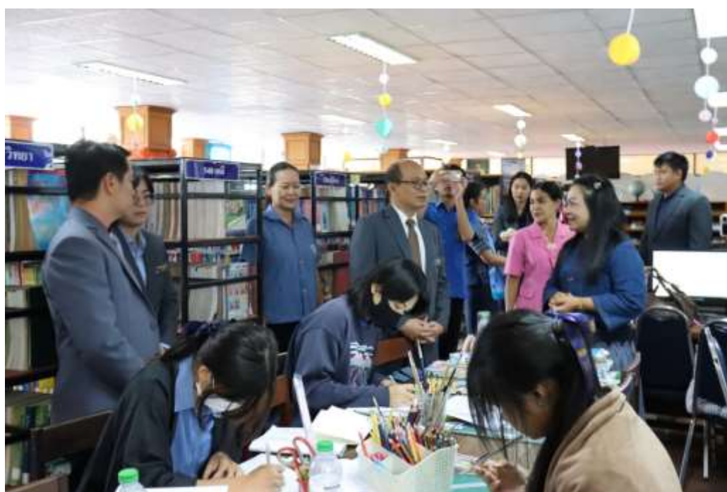
ศึกษาดูงานที่โรงเรียนสว่างแดนดิน อำเภอสว่างแดนดิน จังหวัดสกลนคร