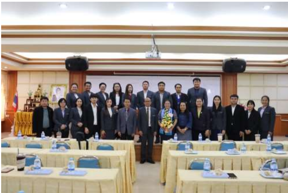
ศึกษาดูงานที่โรงเรียนสว่างแดนดิน อำเภอสว่างแดนดิน จังหวัดสกลนคร