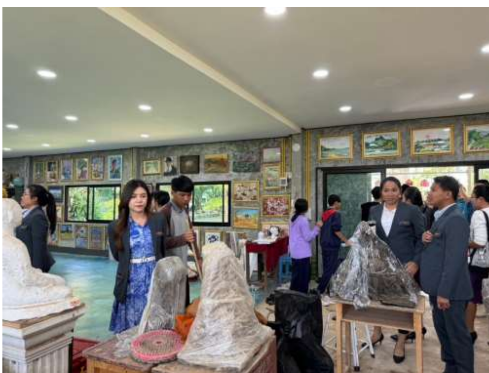
ศึกษาดูงานที่โรงเรียนหนองหินวิทยาคม อำเภอหนองหิน จังหวัดเลย