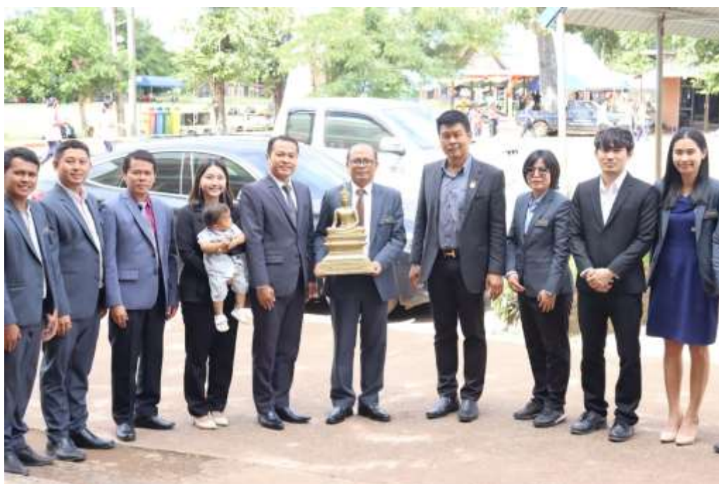
ศึกษาดูงานที่โรงเรียนเซิมพิทยาคม อำเภอโพธาราม จังหวัดหนองคาย