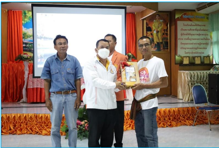
กิจกรรมวันเกษียณอายุราชการ