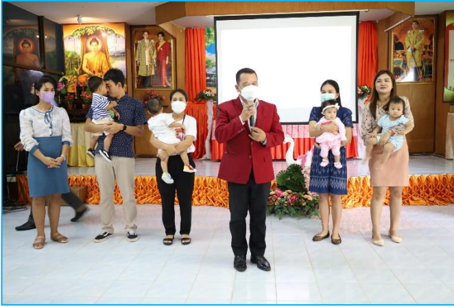
กิจกรรมรับขวัญหลาน