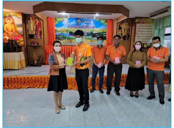
กิจกรรมมอบของขวัญวันเกิด