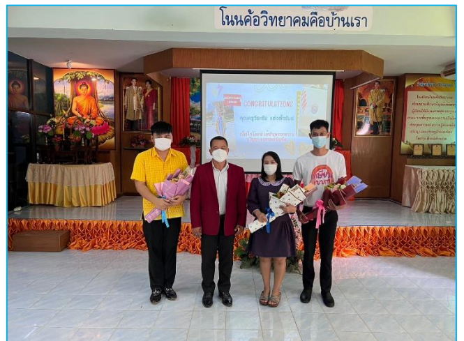
แสดงความยินดีกับบัณฑิต