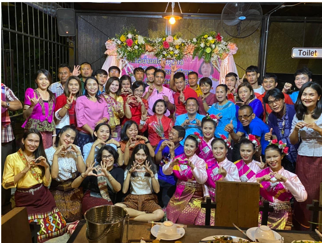
แสดงมุกตลกจิต คุรุครูเกษียณอายุราชการ