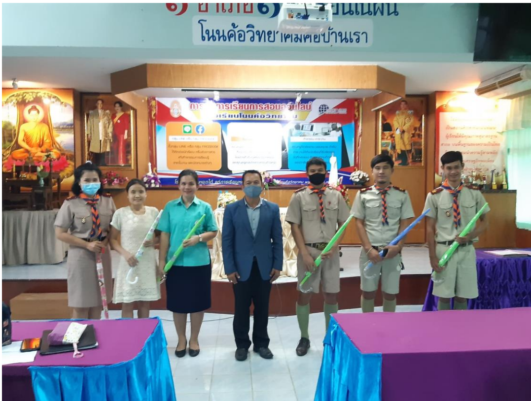
มอบของขวัญเนื่องในวันเกิดบุคลากร ในการประชุมประจำเดือน