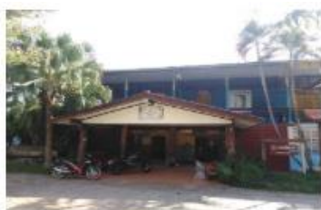
อาคารเรียน ป.1ฉ ปีที่สร้าง 2523