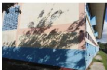
อาคารเรียน สปข. 105/29 ปีที่สร้าง 2532