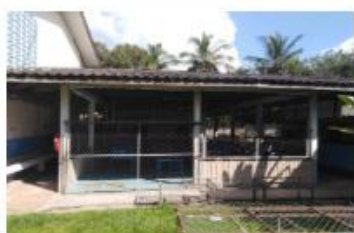
อาคารอเนกประสงค์ 312 ปีที่สร้าง 2523