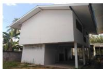
บ้านพักครู สปข. 205/26 ปีที่สร้าง 2561