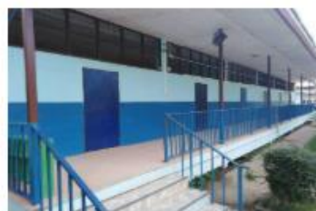
อาคารเรียน สปข. 103/26 ปีที่สร้าง 2525