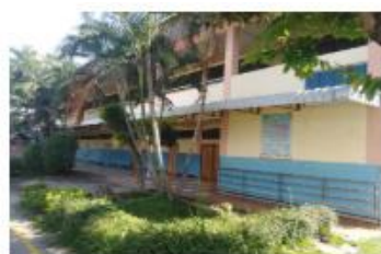
อาคารเรียน สปข. 105/29 ปีที่สร้าง 2540