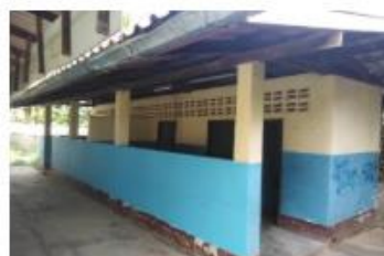
ส้วม สปข. 601/26 ปีที่สร้าง 2534