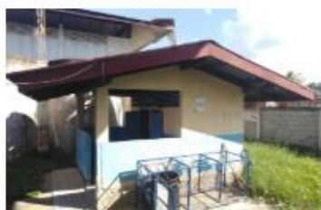
ส้วม สปข. 601/26 ปีที่สร้าง 2528