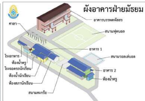
แปลงที่ 2 โรงเรียนบ้านไทยสามัคคี ฝ่ายมัธยม