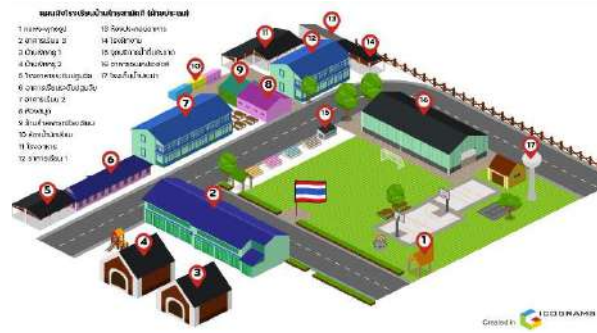
แปลงที่ 1 โรงเรียนบ้านไทยสามัคคี ฝ่ายประถม