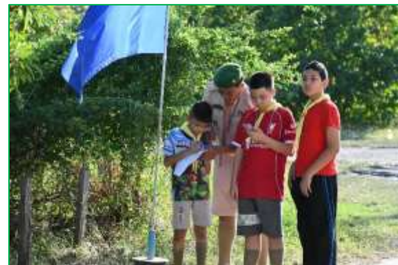
ฐานกิจกรรมเข้าค่ายพักแรมลูกเสือ-เนตรนารี สามัญ