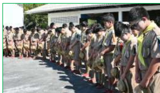
พิธีเปิดกองกิจกรรมเข้าค่ายพักแรมลูกเสือ-เนตรนารี สามัญ