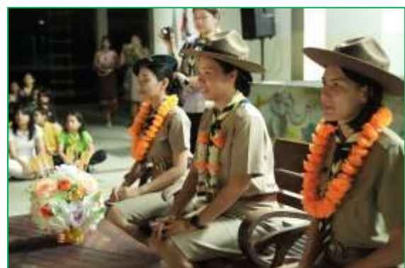
กิจกรรมรอบกองไฟลูกเสือ-เนตรนารี สามัญ