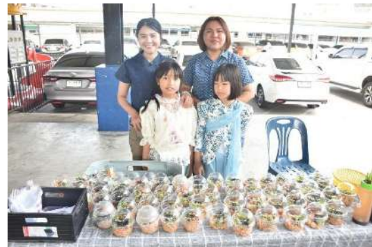
ภาพบรรยากาศการจัดกิจกรรมร้านค้า ๑ ห้องเรียน ๑ อาชีพ