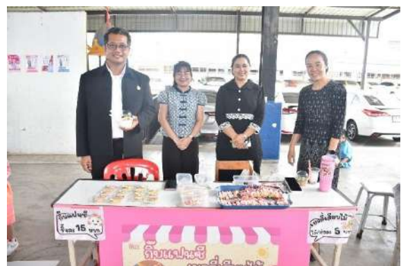
ร้านค้า ๑ ห้องเรียน ๑ อาชีพ