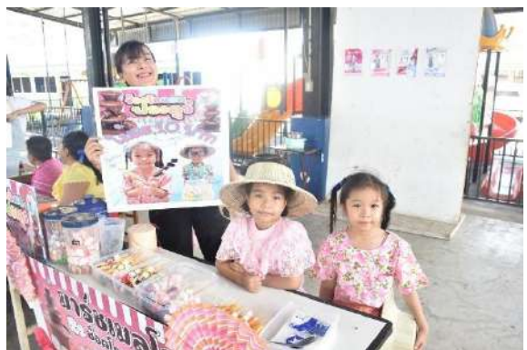
ร้านค้า ๑ ห้องเรียน ๑ อาชีพ