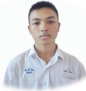
นักเรียนชายมัธยมศึกษาตอนปลาย