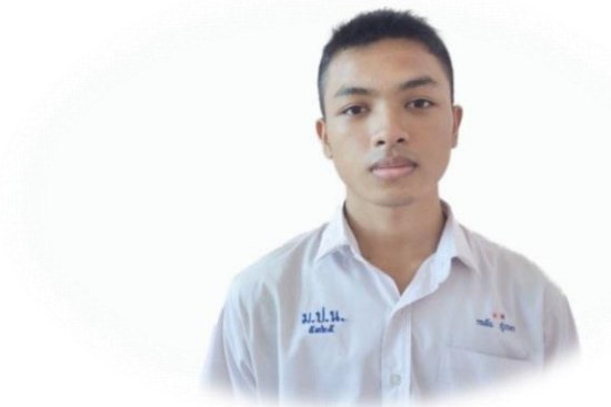
นักเรียนชายมัธยมศึกษาตอนปลาย