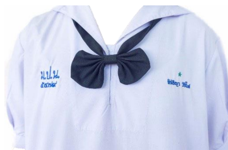
นักเรียนหญิงมัธยมศึกษาตอนต้น