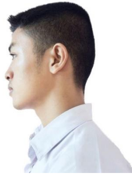
นักเรียนชายมัธยมศึกษาตอนปลาย

ทรงผมนักเรียนชายจะไว้ผมสั้นหรือผมยาวก็ได้ กรณีไว้ผมยาวด้านข้าง ด้านหลังต้องยาวไม่เลยตีนผม ด้านหน้าและกลางศีรษะให้เป็นไปตามความเหมาะสมและความเรียบร้อย หมายเหตุ ไม่อนุญาตให้ไว้จอน หนวด เครา หรือย้อมสีให้ผิดไปจากเดิม การตัดแต่งทรงผมเป็นรูปทรงสัญลักษณ์หรือเป็นลวดลาย