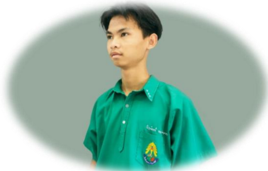
นักเรียนชายมัธยมศึกษาตอนปลาย