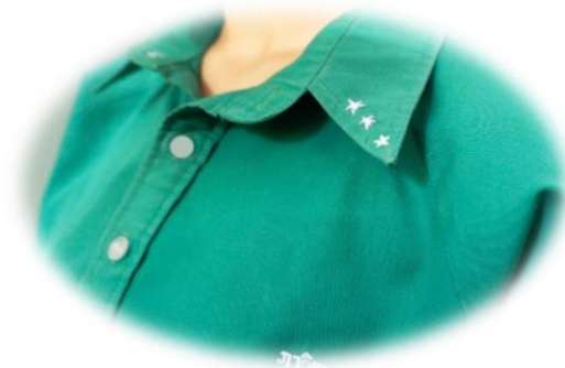
นักเรียนหญิงมัธยมศึกษาตอนปลาย