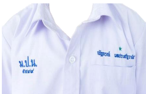
นักเรียนชายมัธยมศึกษาตอนต้น