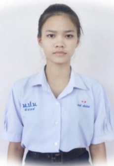
นักเรียนหญิงมัธยมศึกษาตอนปลาย