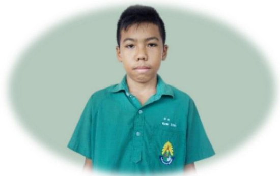
นักเรียนชายมัธยมศึกษาตอนต้น