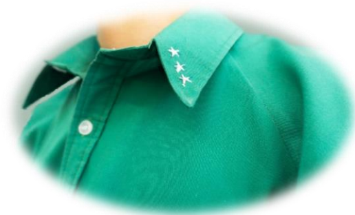
นักเรียนหญิงมัธยมศึกษาตอนปลาย