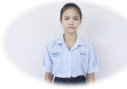
นักเรียนหญิงมัธยมศึกษาตอนปลาย