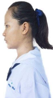
นักเรียนหญิงมัธยมศึกษาตอนต้น

ตัดผมสั้นทรงนักเรียน ให้เสมอใบหูส่วนล่าง ห้าม ไว้ผมหน้าม้า ถักเปีย ซอย ไดร้มนวนหรือเกล้าเป็นมวย ห้ามย้อมสี (ในกรณีผมยาว ให้รวบเก็บผมไปด้านหลังให้เรียบร้อยด้วยกิ๊บหรือยางรัดผมสีดำ ๑ จุก และผูกด้วยริบบิ้นสีกรมท่าเท่านั้น ไม่ปล่อยผมด้านหน้าให้หลุดออกมาและไม่ไว้ผมหน้าม้า ห้ามถักเปียและย้อมสี