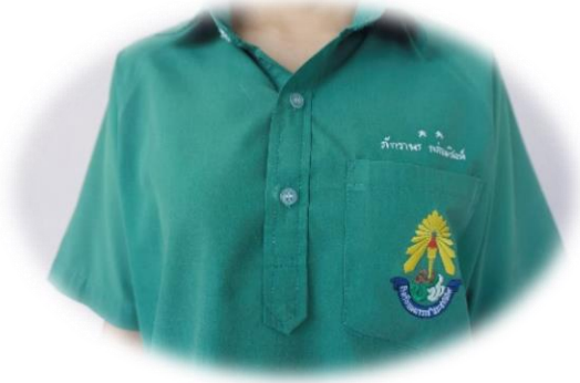
นักเรียนหญิงมัธยมศึกษาตอนต้น