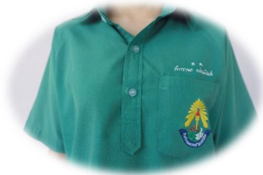
นักเรียนหญิงมัธยมศึกษาตอนต้น