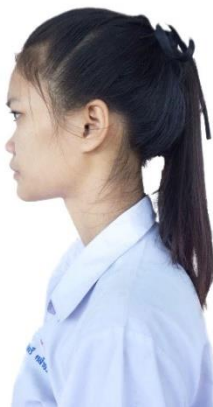
นักเรียนหญิงมัธยมศึกษาตอนปลาย

กรณีผมสั้น ตัดผมสั้นทรงนักเรียน อนุญาตให้ยาวจากใบหูส่วนล่างไม่เกิน ๑ เซนติเมตร ห้าม ไว้ผมหน้าม้า ถักเปีย ซอย ไตรั่ม้วนหรือเกล้าเป็นมวย ห้ามย้อมสี