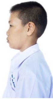
นักเรียนชายมัธยมศึกษาตอนต้น

ตัดทรงนักเรียน ตัดสั้นด้านข้างเกรียน ผมนด้านหน้ายาวไม่เกิน ๓ เซนติเมตร ห้ามไว้จอน หนวด เครา และแสกกลาง ไม่ตัด ไม่ใส่น้ำมันหรือสีย้อม ห้ามโกน (ยกเว้นบวช) หมายเหตุ_ไม่อนุญาตให้เจาะหรือระเบิดหูไม่ว่ากรณีใด ๆ ทั้งสิ้น