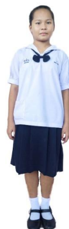
นักเรียนหญิงมัธยมศึกษาตอนต้น

๑. เสื้อ ใช้ผ้าขาวเกลี้ยงไม่บางจนเกินควร ห้ามใช้ ผ้าแพรหรือผ้าที่ไม่สามารถรักษารูปทรงเอาไว้ได้ แบบคอพับในตัว (คอปกกะลาสี) ลีอกพอสวมศีรษะได้สะดวก สาบตลบเข้าข้างใน ส่วนบนของซาบให้ใหญ่พอบอบและคอแล้วไม่เห็นตะเข็บข้างใน ปกเสื้อขนาด ๑๐ เซนติเมตร ใช้ผ้าสองชั้นเย็บแบบเข้าถ้ำแขนยาวเพียงเหนือศอก ปลายแขนจีบเล็กน้อย มีขอบเป็นผ้าสองชั้นกว้าง ๓ เซนติเมตร ขนาดของตัวเสื้อตั้งแต่ใต้แขนถึงขอบล่างมีความกว้างเหมาะกับตัว ไม่รัดเอว ริมขอบล่างของตัวเสื้อด้านขวาติดกระเป๋ากว้าง ๗ - ๑๐ เซนติเมตร ตามส่วนของขนาดตัวเสื้อ ปากกระเป๋าพับเป็นริมกว้างไม่เกิน ๒ เซนติเมตร ต้องสวมเสื้อบังทรง (เสื้อซับใน)