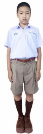
นักเรียนชายมัธยมศึกษาตอนต้น

๑. เสื้อ เป็นเสื้อเชิ้ตแบบคอตั้ง ผ้าขาวเกลี้ยงไม่บางจนเกินควร ตัวเสื้อด้านหน้าผ่าอกตลอด และมีสาบที่อกกว้างประมาณ ๓ - ๔ เซนติเมตร ใช้กระดุมสีขาวกลมแบนขนาดเส้นผ่าศูนย์กลางไม่เกิน ๑ เซนติเมตร แขนเสื้อสั้นเพียงข้อศอก มีกระเป๋าดัดแนวราวนมเบื้องซ้าย ๑ กระเป๋า ขนาดกว้าง ๘ - ๑๒ เซนติเมตรและลึก ๑๐ - ๑๕ เซนติเมตรพอเหมาะกับขนาดของเสื้อ และขนาดของเสื้อพอเหมาะกับลำตัว เสื้อไม่มีจีบ ไม่มีเกล็ด ไม่รัดรูป ไม่ผ่า แขน เวลาสวมต้องกลัดกระดุมทุกเม็ด ยกเว้นเม็ดแรกที่คอ สอดชายเสื้อไว้ในกางเกงให้เรียบร้อยโดยต้องให้เห็นเข็มขัดโดยรอบเอว