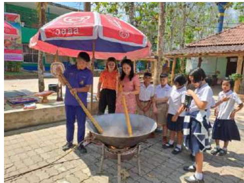
กิจกรรมนอกห้องเรียนโดยคณะกรรมการสถานศึกษามอบความรู้ให้กับครูและนักเรียน