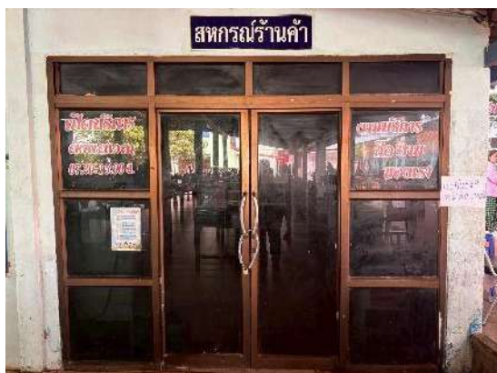
สวัสดิการร้านค้า