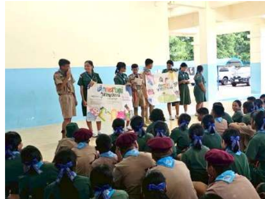
โรงเรียนคุณธรรม (คุณธรรมอัตลักษณ์)