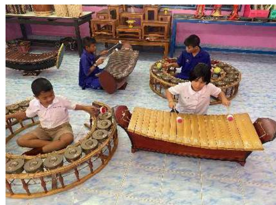
ห้องดนตรีไทย