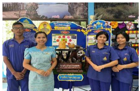
การนำเสนอพระบรมราโชบาย ด้านการศึกษ มุ่งงานทำ มีอาชีพ