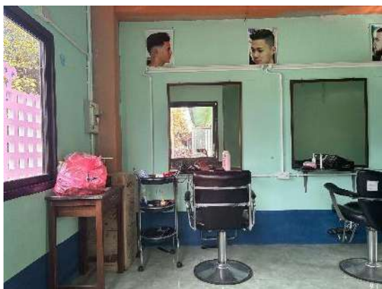
ห้องตัดผม