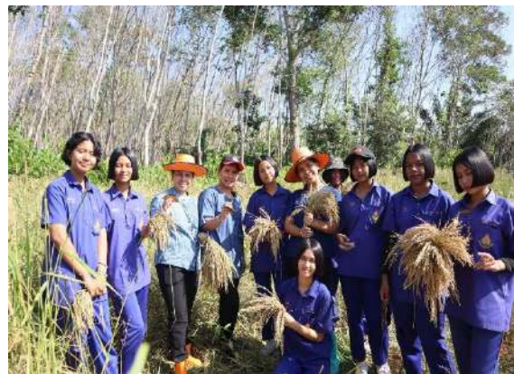
การดำนาปลูกข้าว