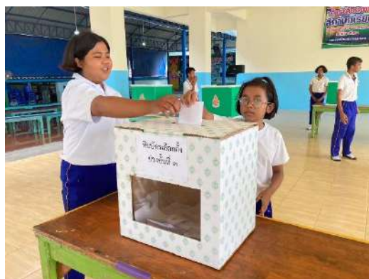
ส่งเสริมระบอบประชาธิปไตย