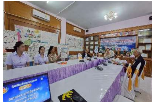
โครงการมูลนิธิยุวพัฒน์