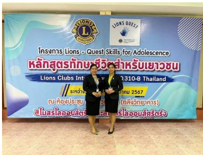
เข้ารับการอบรมโครงการ Lions-Quest Skills for Adolescence หลักสูตรทักษะชีวิตสำหรับเยาวชน ระหว่างวันที่ 19-20 ธันวาคม 2567 ณ โรงเรียนห้วยยอด (กลิ่งวิทยาการ)