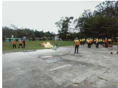
องค์การบริหารส่วนตำบลอ่าวตงให้ความอนุเคราะห์อำนวยความสะดวกอบรมให้ความรู้