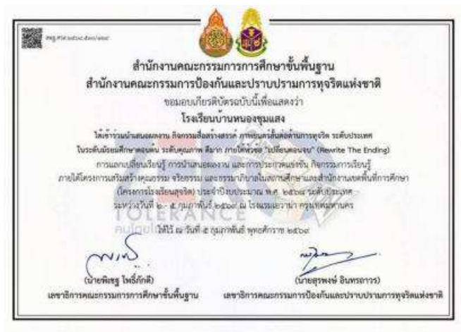
โรงเรียนบ้านหนองชุมแสง การนำเสนอผลงาน กิจกรรมสื่อสร้างสรรค์ ภาพยนตร์สั้นต่อต้านการทุจริต ระดับประเทศ ในระดับมัธยมศึกษาตอนต้น ภายใต้หัวข้อ "เปลี่ยนตอนจบ" (Rewrite the ending) ระดับดีมาก วันที่ 5 กุมภาพันธ์ 2569