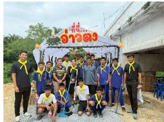
จิตอาสาร่วมพัฒนาชุมชน