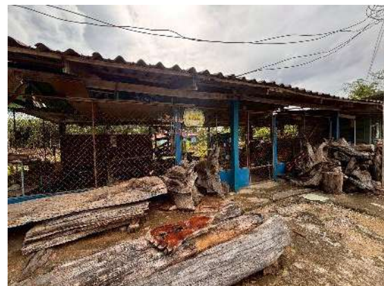
ห้องช่างไม้