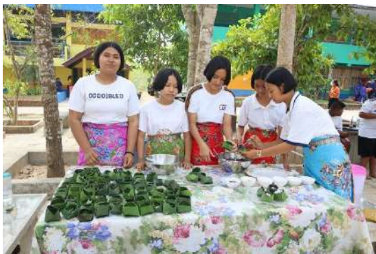
การแปรรูปอาหารจากวัสดุ ที่ทำจากข้าวสสาร