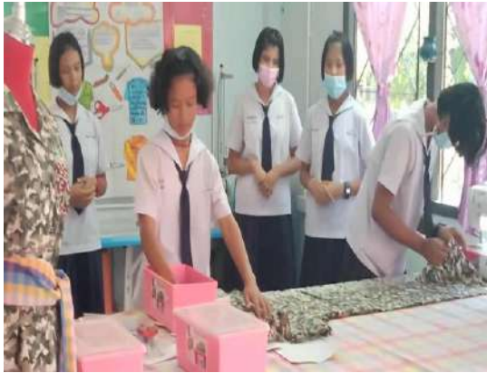
ห้องตัดเย็บ