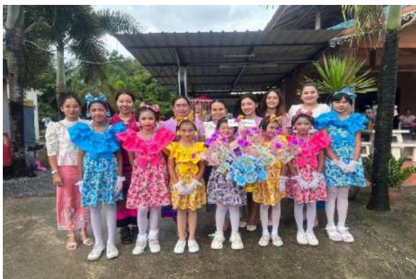
ครูและนักเรียนมีส่วนร่วมกับชุมชนในกิจกรรมทอดกฐิน ณ วัดหนองชุมแสง อำเภอวังวิเศษ