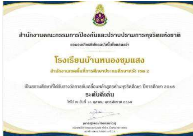
โรงเรียนบ้านหนองชุมแสง การขับเคลื่อนหลักสูตรด้านทุจริตศึกษา ประจำปี 2568 ระดับดีเด่น วันที่ 16 ตุลาคม 2568