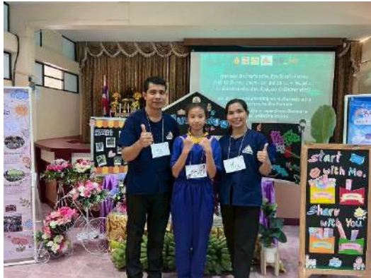
อบรมคุณธรรมคำพ่อสอน