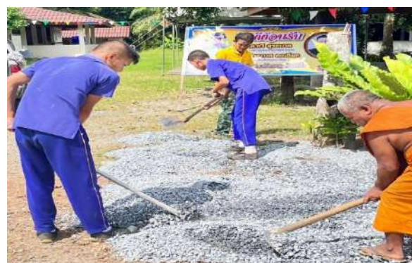
ครูและนักเรียนมีส่วนร่วมกับชุมชนในกิจกรรมจิตอาสา ณ วัดโคกกฐิน อำเภอวังวิเศษ