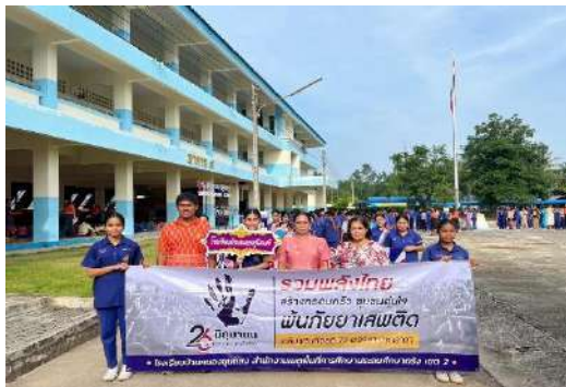
รณรงค์ป้องกันและห่างไกลยาเสพติด