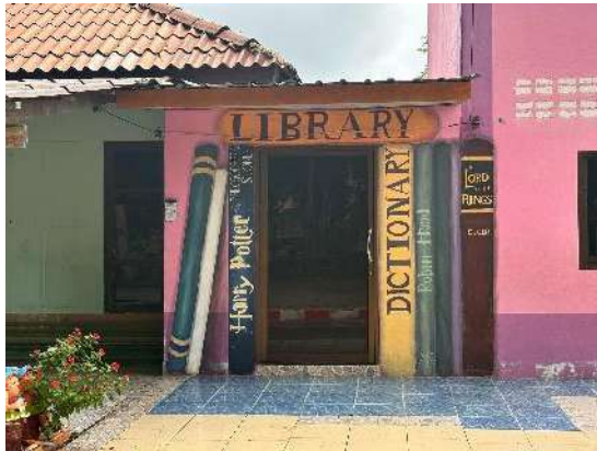
ห้องสมุด

มีการบริหารจัดการด้านอาคารสถานที่และแหล่งเรียนรู้ภายในและภายนอกสถานศึกษา ให้ความปลอดภัย สะอาด และเหมาะสม ส่งเสริมการเรียนรู้ให้กับผู้เรียนตามวัย โดยการขับเคลื่อนการพัฒนาแหล่งเรียนรู้ และจัดสภาพแวดล้อมภายในและนอกโรงเรียนพร้อมใช้งานตลอดเวลา ด้วยโครงการเศรษฐกิจพอเพียง โครงการพัฒนาอาคารสถานที่ โครงการยกระดับผลสัมฤทธิ์ กิจกรรมพัฒนาแหล่งเรียนรู้ โครงการสิ่งแวดล้อม โดยในโครงการทุกโครงการมีการแต่งตั้งคณะกรรมการดำเนินงาน มีครูและนักเรียน เป็นผู้รับผิดชอบ ดูแล ตรวจสอบ พื้นที่ในโรงเรียนให้มีความสะอาด ปลอดภัย ผ่านกิจกรรม วิถีลูกเสือเพื่อความสะอาด จัดให้มีครูเวรรักษาการณ์ในวันราชการ และวันหยุดราชการ เพื่อดูแลความเรียบร้อยในโรงเรียน มีการประสานความร่วมมือจากชุมชน ภาครัฐ ภาคเอกชน ในการเข้ามามีส่วนร่วมในการพัฒนาแหล่งเรียนรู้ และจัดสภาพแวดล้อมภายในและนอกโรงเรียน มีการประชาสัมพันธ์กิจกรรมต่างๆ ของโรงเรียนอย่างต่อเนื่อง เพื่อสร้างความเชื่อมั่นให้กับผู้ปกครอง ชุมชน และหน่วยงานต้นสังกัด