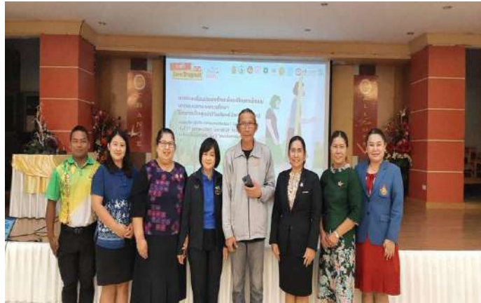
ร่วมประชุมขับเคลื่อนประเทศไทยเพื่อแก้ปัญหาเด็กและเยาวชนนอกระบบการศึกษา ให้กลายเป็นศูนย์ Thailand Zero Dropout วิทยาลัยเทคนิคตรัง