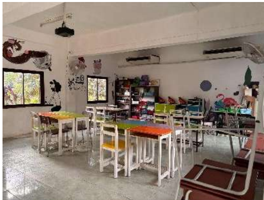
ห้องปฏิบัติการวิทยาศาสตร์