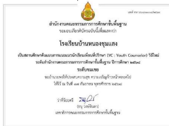
เป็นสถานศึกษาด้านแบบการแนะแนวกิจกรรมนักเรียนเพื่อนที่ปรึกษา (YC : Youth Counselor) วิถีใหม่ ระดับสำนักงานคณะกรรมการการศึกษาขั้นพื้นฐาน ระดับชมเชย