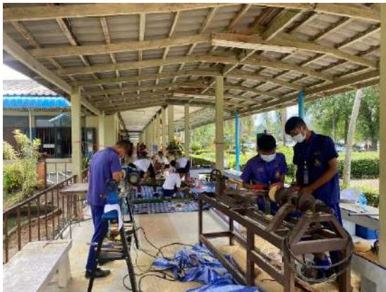
ทักษะอาชีพงานช่างไม้