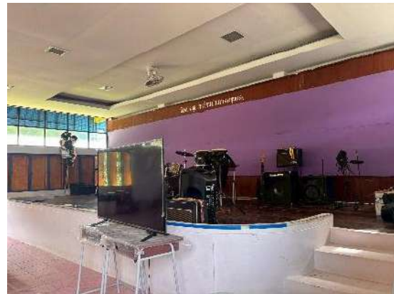
ห้องดนตรีสากล