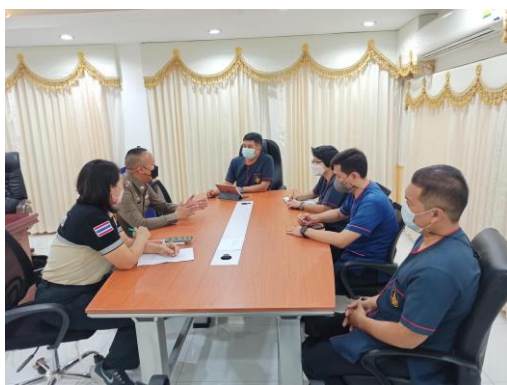
โครงการ 1 ดำรวจ 1 โรงเรียน