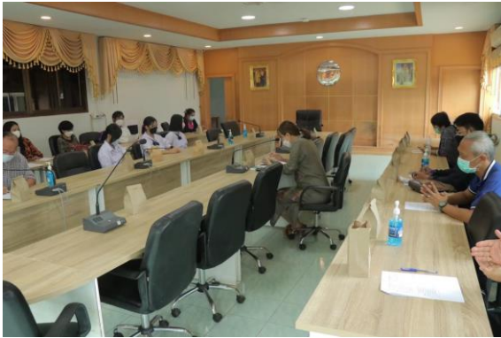
การประชุมภาคี 4 ฝ่าย