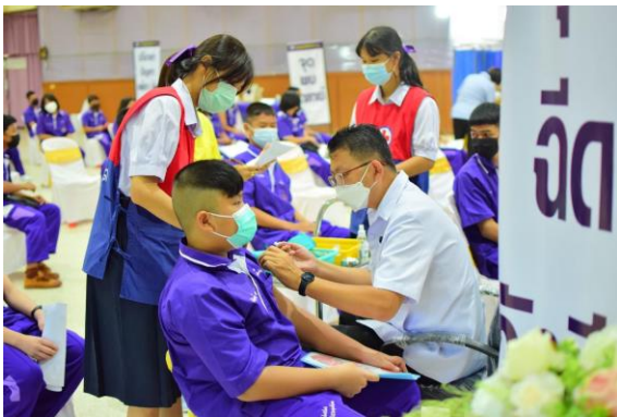
การฉีดวัคซีนให้นักเรียน