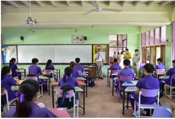
การตรวจเยี่ยมชั้นเรียนโดยผู้ว่าราชการจังหวัด