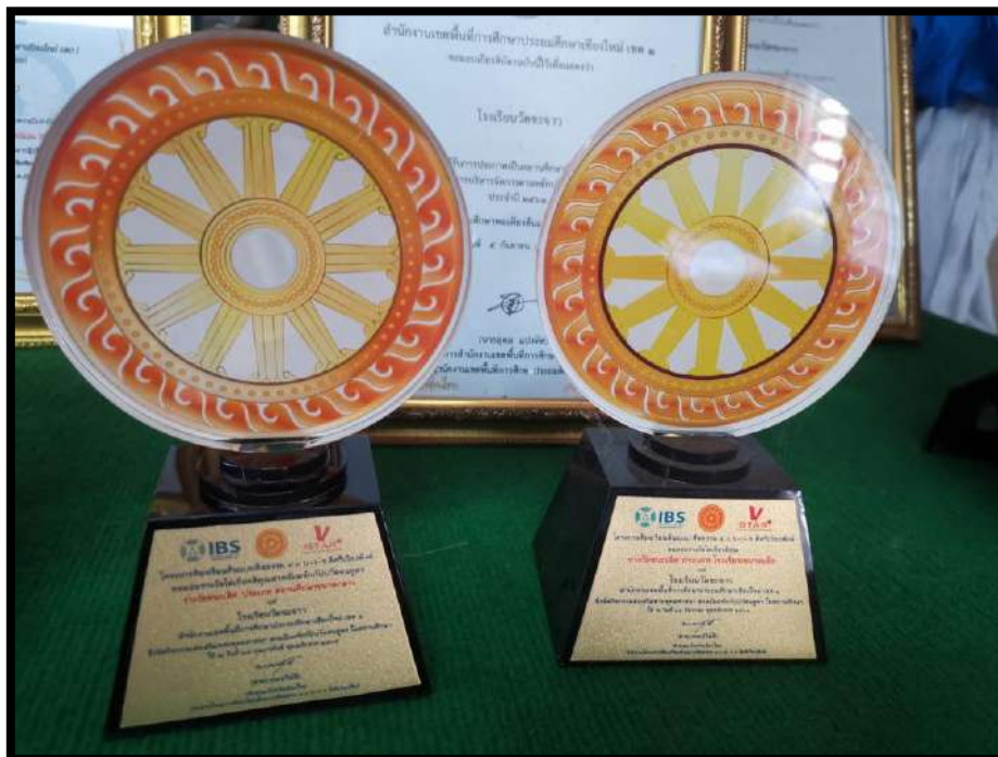
รางวัลชนะเลิศ สวดธัมมจักกัปปวัตตนสูตร ประเภทสถานศึกษานาดกลาง โครงการห้องเรียนต้นแบบศีลธรรม ๔.๐ บ-ว-ร ดิสรวิเวียงพิงค์