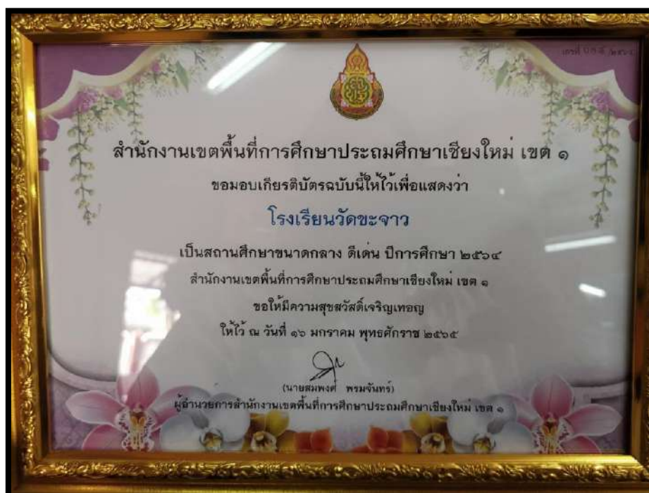
สถานศึกษาขนาดกลาง ดีเด่น ปีการศึกษา ๒๕๖๔