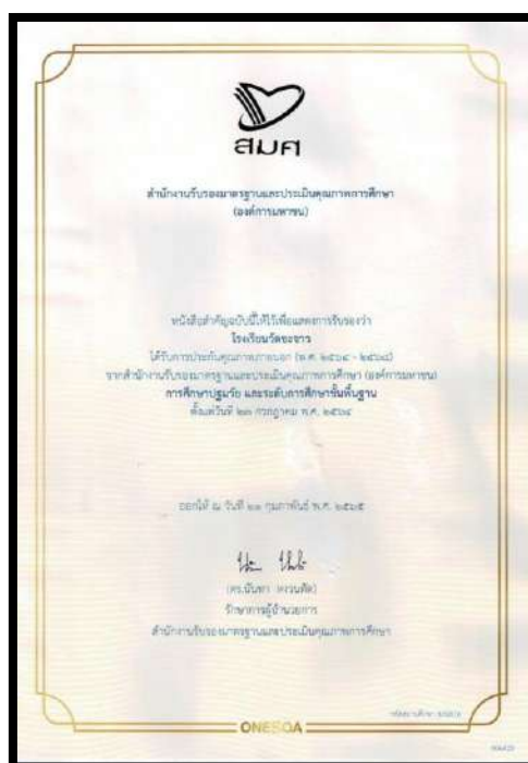
ได้รับการประกันคุณภาพภายนอก (พ.ศ.๒๕๖๔ - ๒๕๖๘)

จากสำนักงานรับรองมาตรฐานและประเมินคุณภาพการศึกษา (องค์การมหาชน)