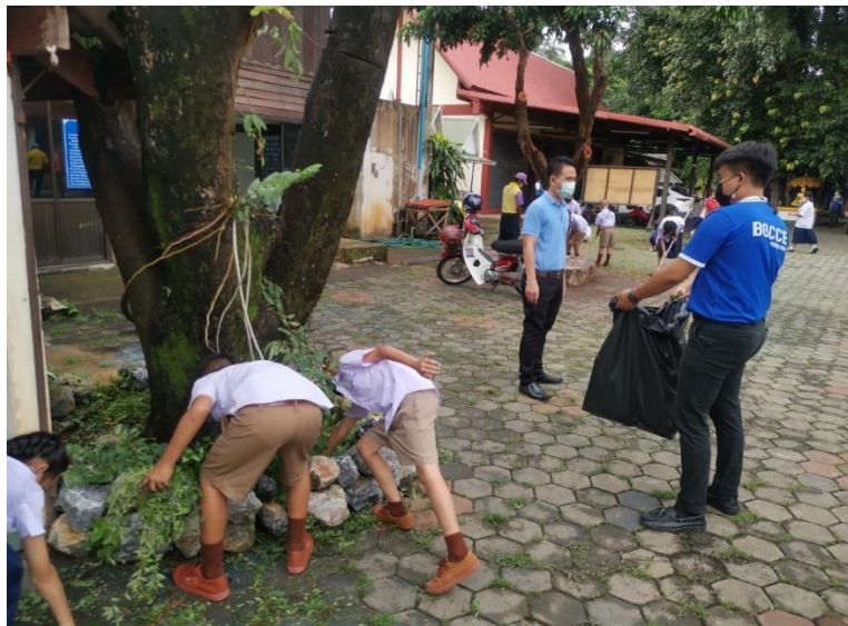
งานจิตอาสาวันแม่แห่งชาติ