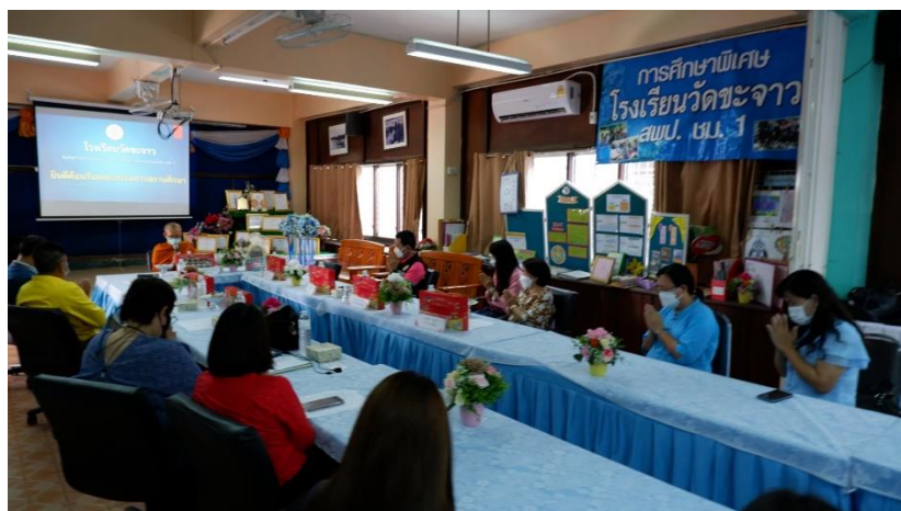
งานดำหัวปีใหม่เมือง