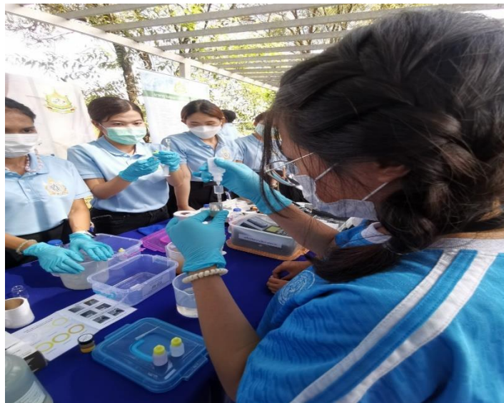
งานปวงประชาร่วมใจ คืบหน้าให้แผ่นดิน