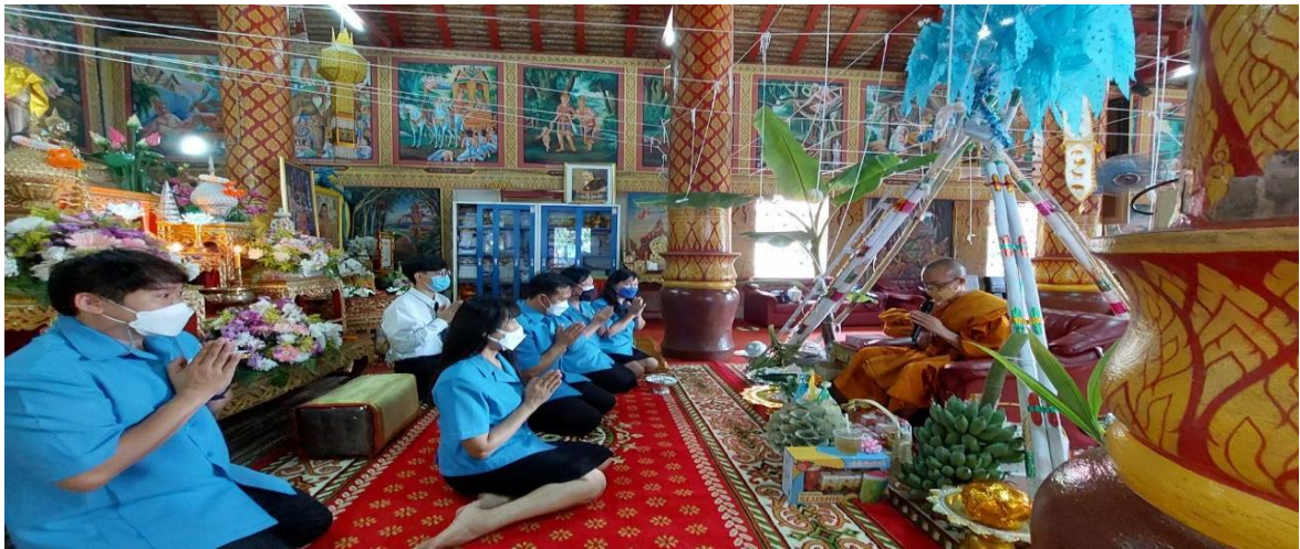
งานทำบุญวัดลังกา