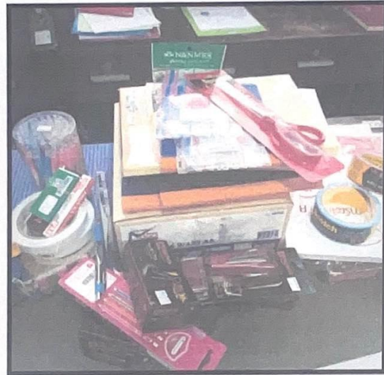
การดำเนินงานตามโครงการงานธุรการ