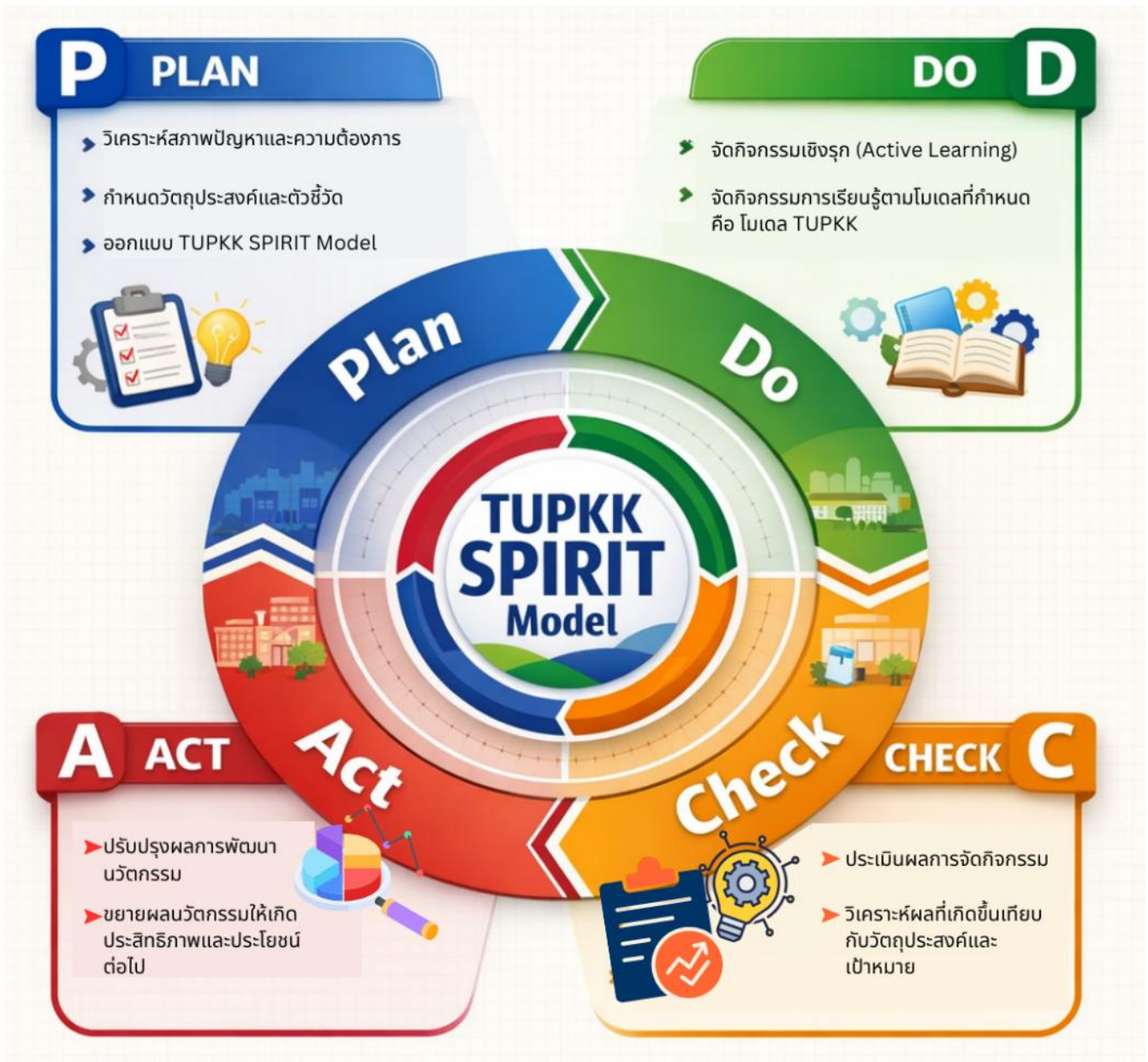
แผนภาพที่ 1 แสดงขั้นตอนการพัฒนาวัตกรรมการ “TUPKK SPIRIT Model เสริมสร้างทัศนคติที่ดี ด้วยวิถีเตรียมพัฒนาฯ ขอนแก่น” ตามกระบวนการ PDCA