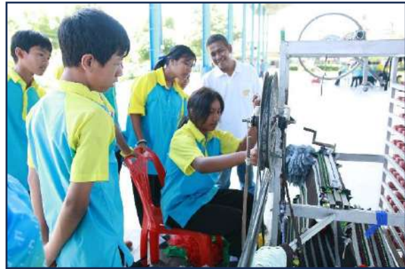
ภาพกิจกรรมแนะแนวอาชีพนักเรียนที่จบการศึกษาภาคบังคับ