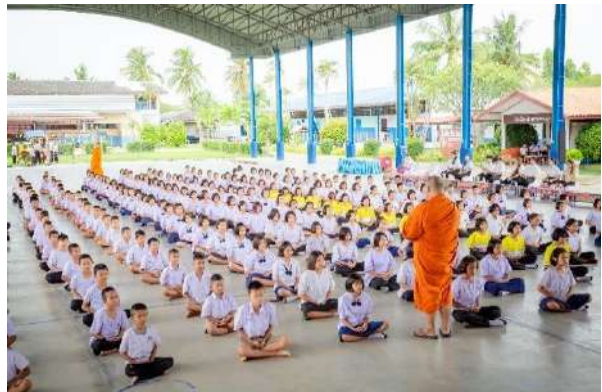
ภาพกิจกรรมการอบรมคุณธรรม จริยธรรม