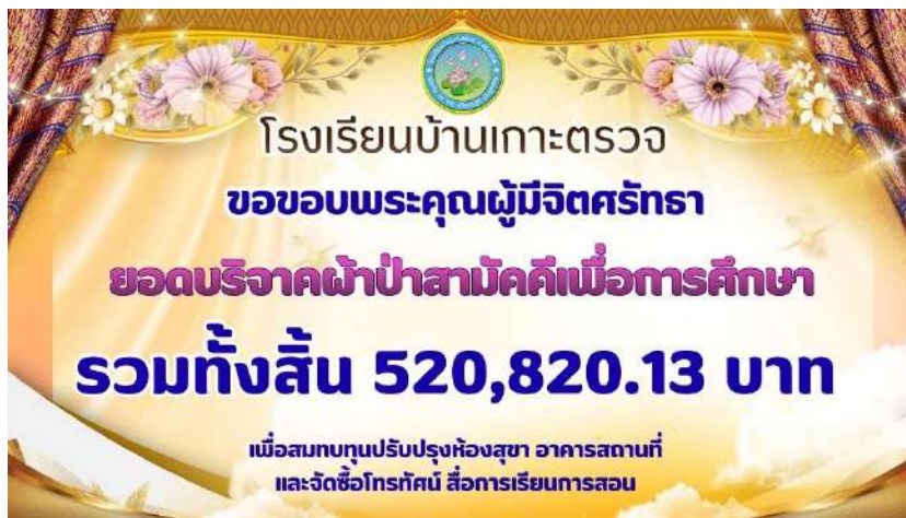
กิจกรรมวันคล้ายวันสถาปนาโรงเรียนบ้านเกาะตรวจและผ้าป่าเพื่อการศึกษา