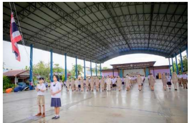
ภาพกิจกรรมหน้าเสาธงและกิจกรรมวันพระราชทานธงชาติไทย