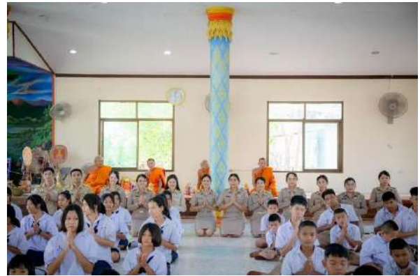
ภาพกิจกรรมวันสำคัญทางศาสนา