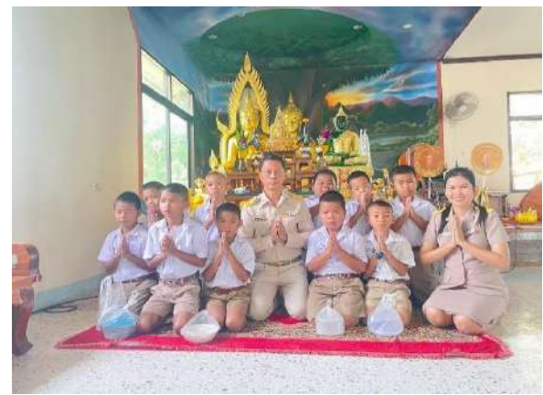
ภาพกิจกรรมถือตะกร้า หิ้วปิ่นโต เข้าวัด ทำบุญ ฟังธรรม