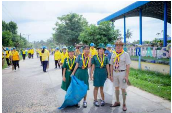
ภาพกิจกรรมลูกเสือจิตอาสาพระราชทาน