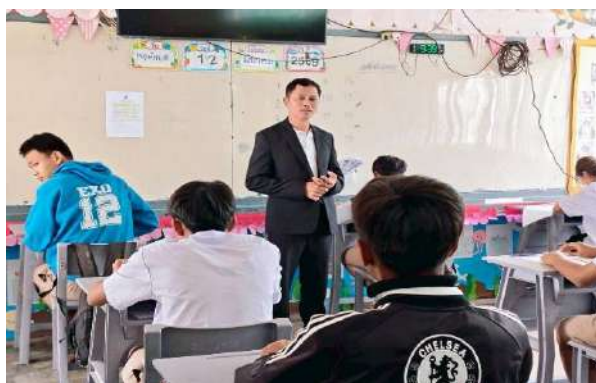
ภาพกิจกรรมรับสมัครนักเรียน