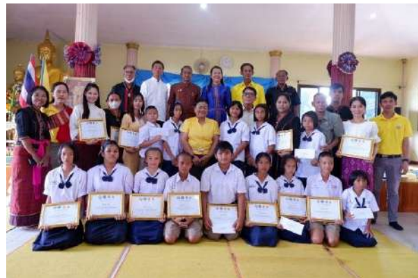
ภาพกิจกรรมประเพณีบุญร่วมมิตรประจำปี ตำบลตรวจ