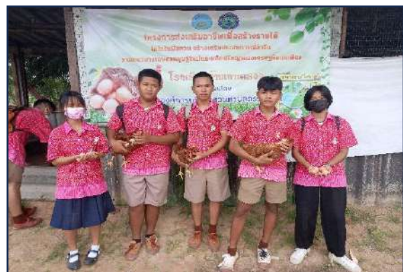
ภาพการดำเนินโครงการส่งเสริมการเรียนรู้ตามหลักปรัชญาของเศรษฐกิจพอเพียง (สถานศึกษาพอเพียง)