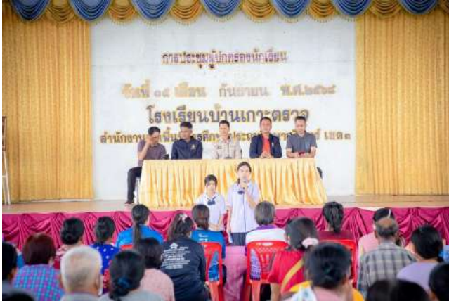
กิจกรรมการประชุมผู้ปกครอง

โรงเรียน ชุมชน และเครือข่าย มีความสัมพันธ์ที่ดีในการร่วมมือ ร่วมใจ ในการพัฒนาคุณภาพการศึกษา และพัฒนาคุณภาพนักเรียน ซึ่งนอกจากการจัดประสบการณ์ดี ๆ ให้กับนักเรียนแล้ว ชุมชนยังเข้ามาแลกเปลี่ยนเรียนรู้ระหว่างโรงเรียน และชุมชนในด้านต่าง ๆ อีกด้วย