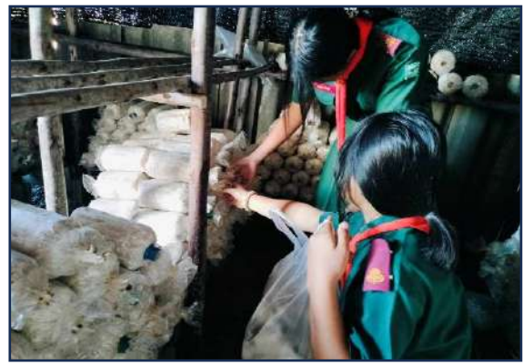
ภาพการดำเนินโครงการเพาะเห็ดสร้างอาหาร