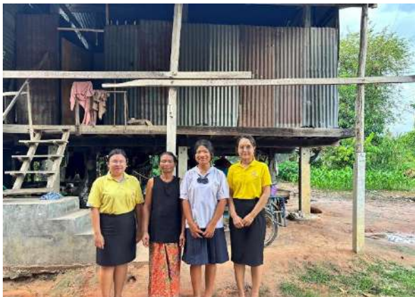
กิจกรรมการเยี่ยมบ้าน