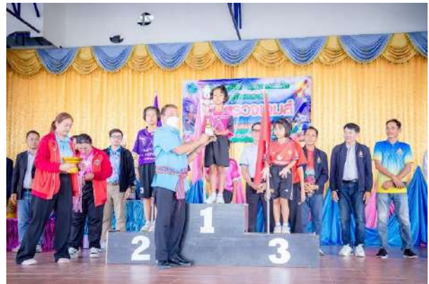
ภาพกิจกรรมกีฬาภายในต้านภัยยาเสพติด