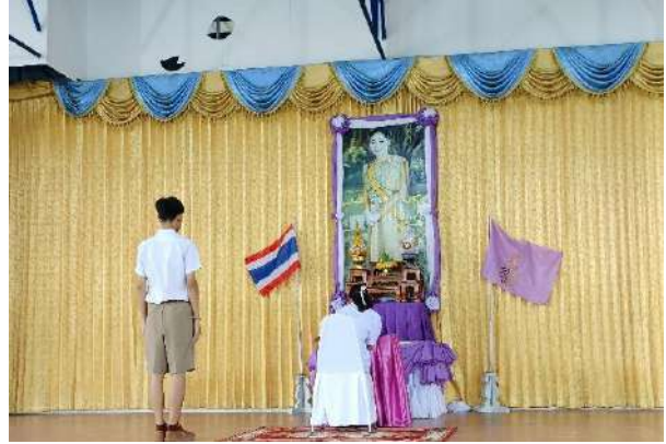
ภาพกิจกรรมเฉลิมพระเกียรติ เทิดทูนสถาบัน