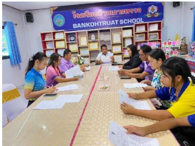
กิจกรรมการประชุมคณะกรรมการภาคี 4 ฝ่าย