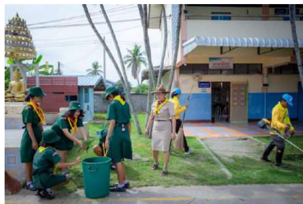
ภาพกิจกรรมปลูกเสื่อจิตอาสาเพื่อสังคมและสาธารณประโยชน์