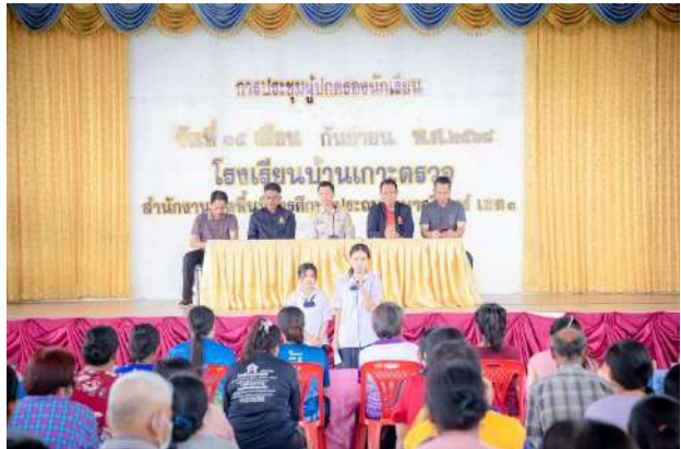
ภาพกิจกรรมสถานนักเรียน