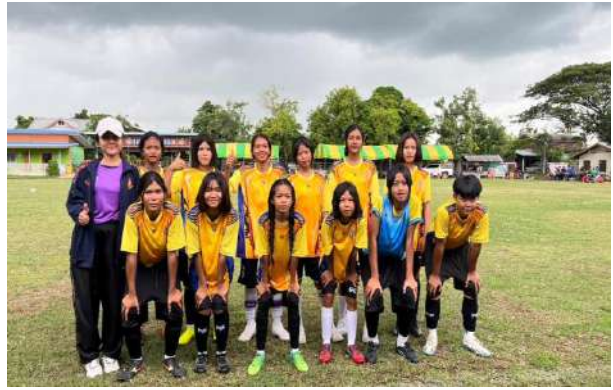
ภาพกิจกรรมกิจกรรมกีฬาระดับเครือข่าย