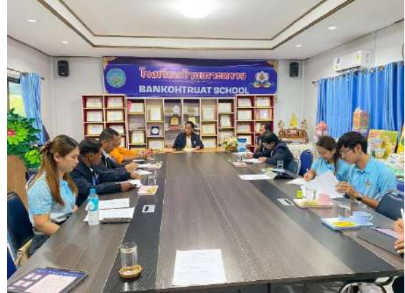
การประชุมคณะกรรมการสถานศึกษา