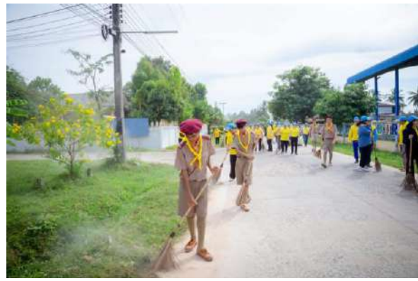
ภาพกิจกรรมปลูกเสื่อจิตอาสา