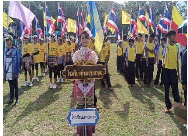
ภาพกิจกรรมกีฬา อบต.