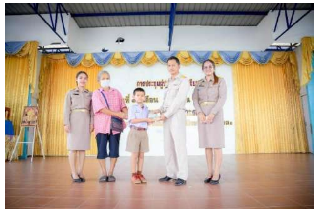
กิจกรรมการมอบทุนนักเรียน