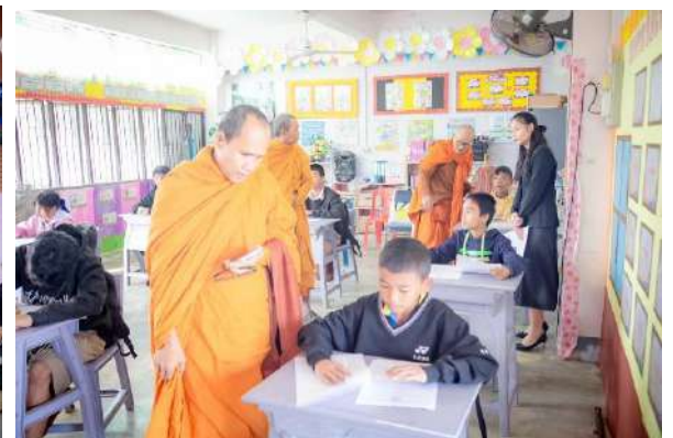
ภาพการดำเนินโครงการกิจกรรมสอบธรรมสนามหลวง