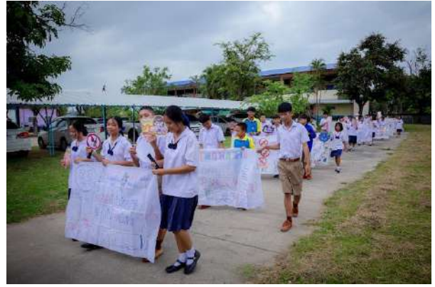
ภาพกิจกรรมโรงเรียนปลอดบุหรี่ อบายมุข และสิ่งเสพติด