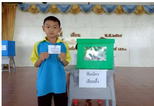
ภาพกิจกรรมเลือกตั้งสภานักเรียน