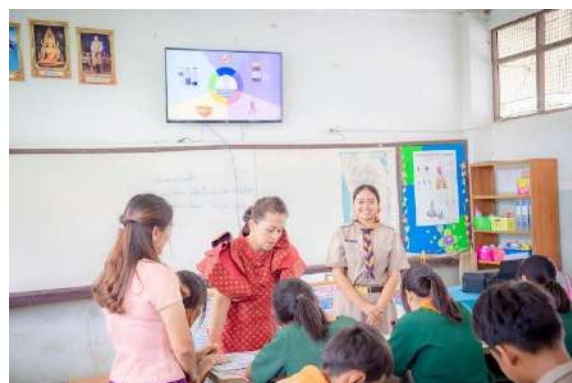
ภาพกิจกรรมแนะแนวการศึกษาต่อ