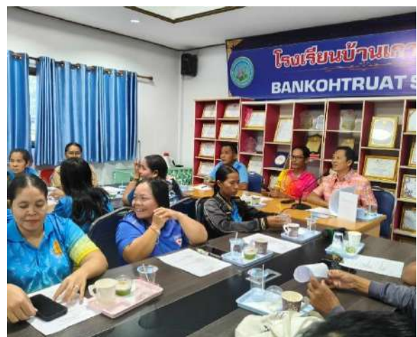
กิจกรรมการประชุมคณะกรรมการ เครือข่ายผู้ปกครอง