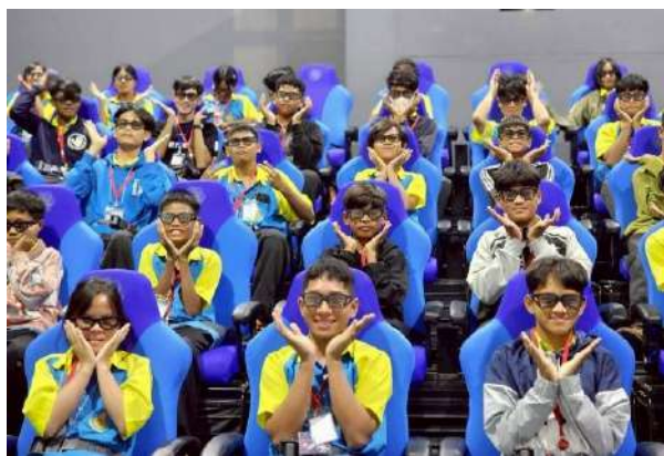
ภาพกิจกรรมทัศนศึกษาแหล่งเรียนรู้นอกสถานศึกษา