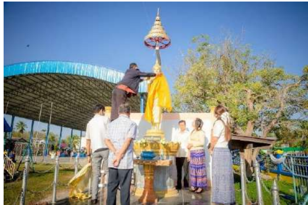
ภาพกิจกรรมวันคล้ายวันสถาปนาโรงเรียน