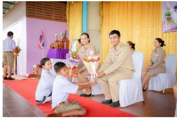
ภาพกิจกรรมวันไหว้ครู