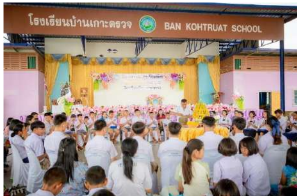
ภาพกิจกรรมปัจฉิมนิเทศนักเรียนชั้นประถมศึกษาปีที่ 6 และ ชั้นมัธยมศึกษาปีที่ 3