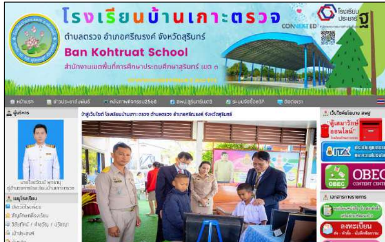
ภาพเว็บไซต์โรงเรียนบ้านเกาะตรวจ

7.1) ได้มีการเผยแพร่และประชาสัมพันธ์ ผลงานและกิจกรรมต่างๆ ผ่านทางเว็บไซต์โรงเรียน www.kohtruat.ac.th