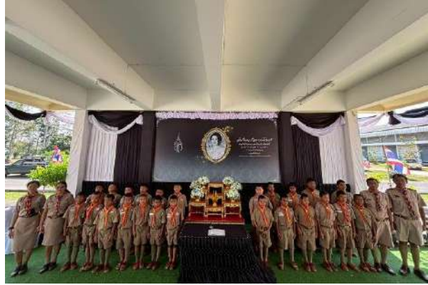
ภาพกิจกรรมถวายความอาลัยและน้อมรำลึกในพระมหากรุณาธิคุณสมเด็จพระนางเจ้าสิริกิติ์ พระบรมราชินีนาถ พระบรมราชชนนีพันปีหลวง