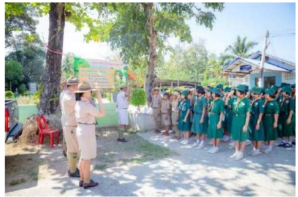
ภาพการดำเนินโครงการค่ายพักแรมลูกเสือสำรอง ลูกเสือสามัญ ลูกเสือสามัญรุ่นใหญ่