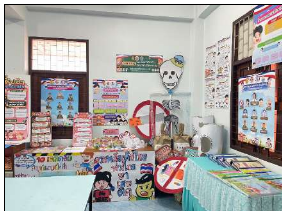
รูปภาพแหล่งเรียนรู้ภายในห้องศูนย์การเรียนรู้โครงการสถานศึกษาสีขาว ปลอดภัยเสถียรและอบายมุข