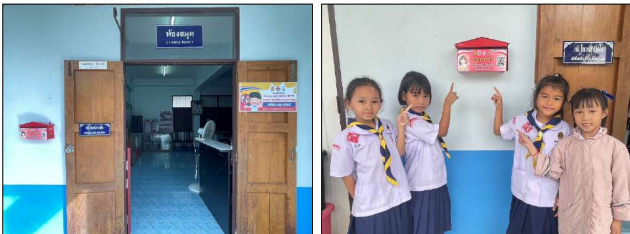
รูปภาพศูนย์เรียนรู้โครงการสถานศึกษาสีขาว ปลอดภัยเสถียรและอบายมุข