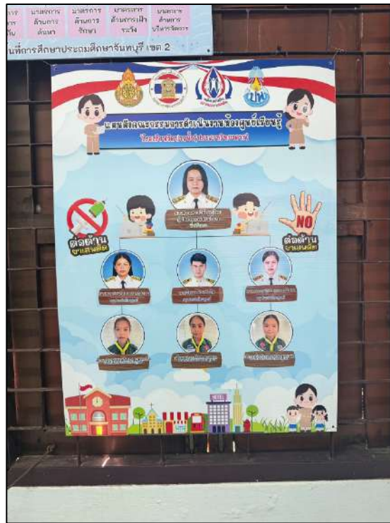
รูปภาพแผนผังแสดงโครงสร้างคณะกรรมการดำเนินงาน ศูนย์การเรียนรู้โครงการสถานศึกษาสีขาวปลอดภัยเสถียรและอบายมุข