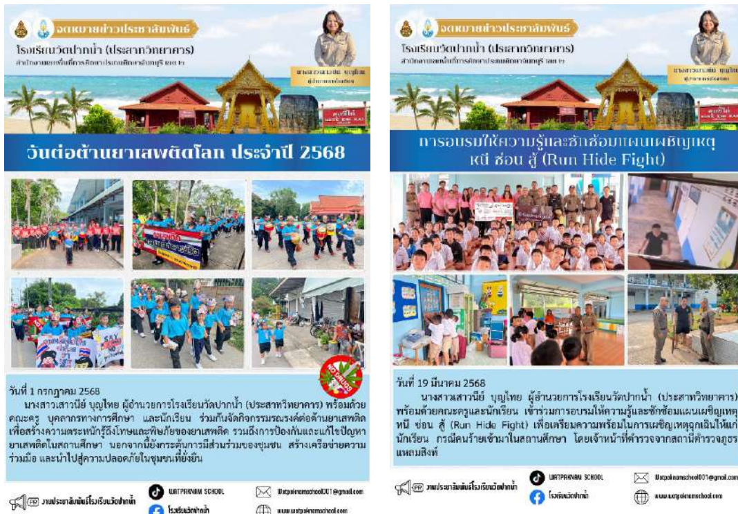
รูปภาพจัดทำภาพข่าวประชาสัมพันธ์การจัดกิจกรรมต่างๆ

๔.๑ จัดทำภาพข่าวประชาสัมพันธ์การจัดกิจกรรมต่างๆ ของห้องศูนย์เรียนรู้โครงการสถานศึกษาสีขาว ปลอดภัยเสพติดและ อบายมุข เผยแพร่ลงในกลุ่มประชาสัมพันธ์ บนแอปพลิเคชัน line และสื่อสังคมออนไลน์ของสถานศึกษา ได้แก่เพจ Facebook