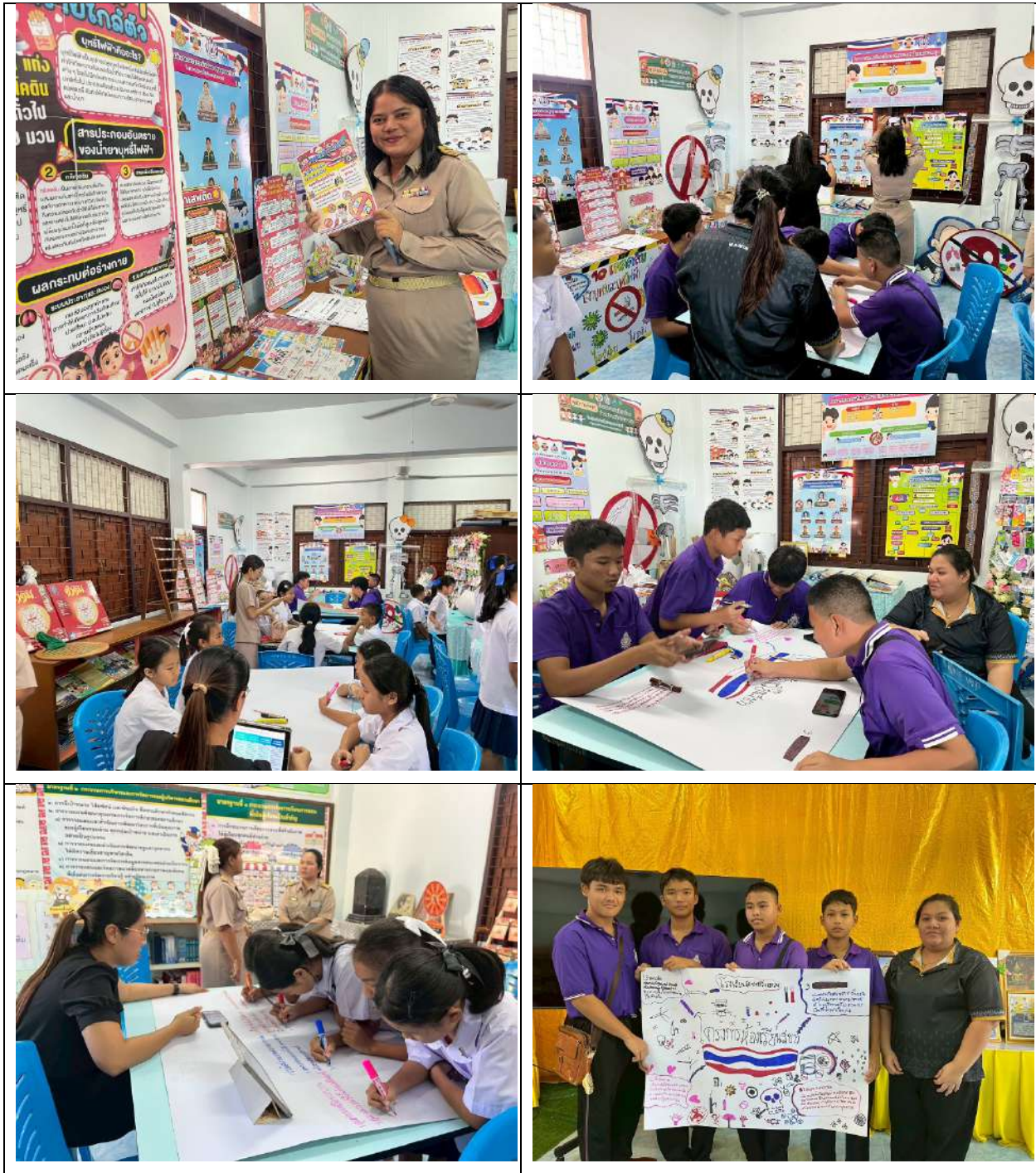
รูปภาพการศึกษาดูงาน เยี่ยมชม แลกเปลี่ยนเรียนรู้การดำเนินงาน และกิจกรรมต่างๆ