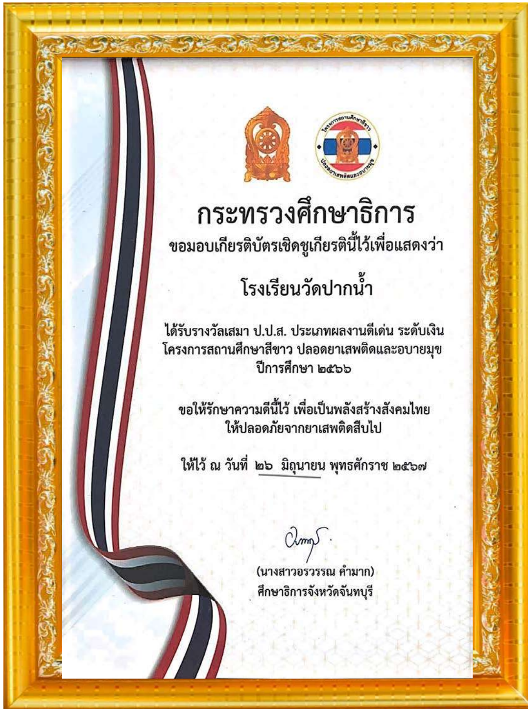
ภาพที่ ๑ โรงเรียนวัดปากน้ำ ฯ ได้รับรางวัล “เสมา ป.ป.ส. ประเภทผลงานดีเด่น ระดับเงิน”

ด้วยความมุ่งมั่นในการขับเคลื่อนนวัตกรรมและผลการปฏิบัติงานที่เป็นเลิศ (Best Practice) ภายใต้โครงการสถานศึกษาสีขาว ปลอดภัยเสถียรและอบายมุขอย่างต่อเนื่องและเป็นรูปธรรม ส่งผลให้โรงเรียนวัดปากน้ำ (ประสาทวิทยาการ) มีระบบการบริหารจัดการที่เข้มแข็ง จนเป็นที่ประจักษ์และได้รับการยกย่องเชิดชูเกียรติจากหน่วยงานต้นสังกัดและองค์กรภาคีเครือข่าย ดังรายละเอียดต่อไปนี้