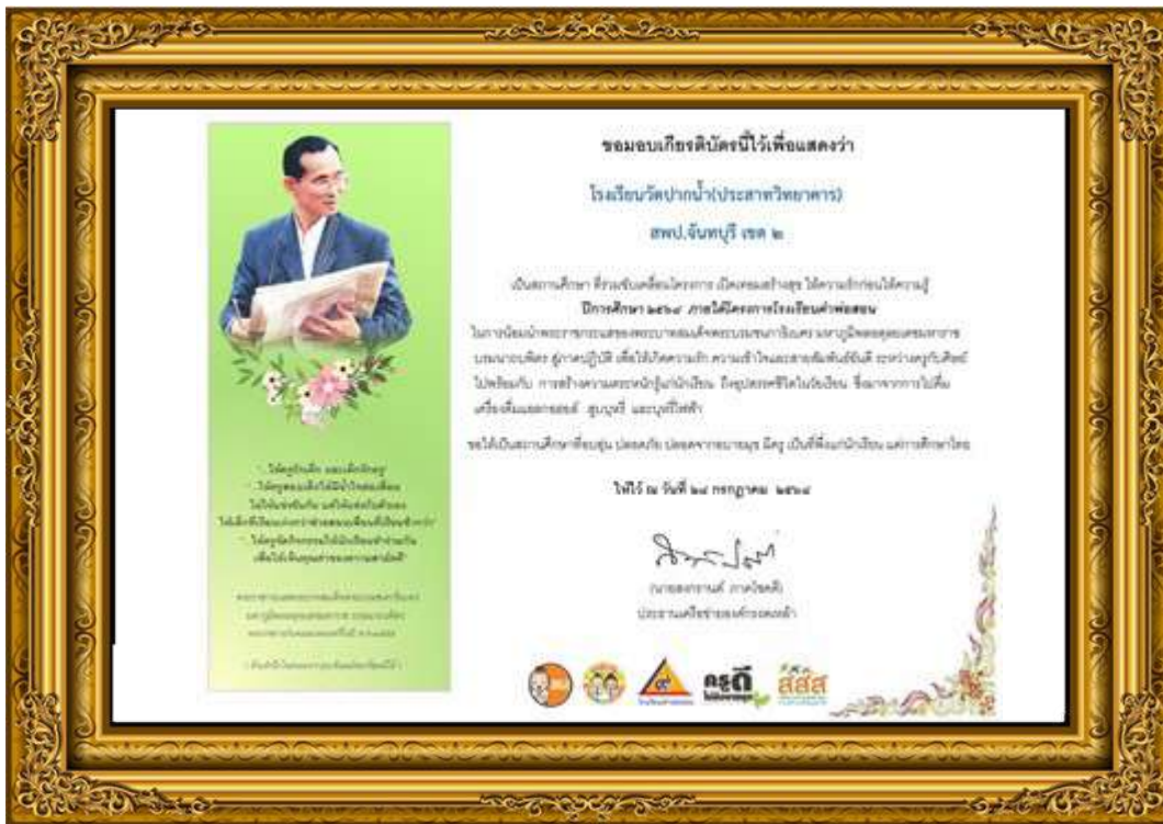
ภาพที่ ๑๕ ร่วมขับเคลื่อนโครงการ เปิดเทอมสร้างสุข ให้ความรักก่อนให้ความรู้ ปีการศึกษา ๒๕๖๘ ภายใต้โครงการโรงเรียนคำพ่อสอน ในการน้อมนำพระราชกระแสของพระบาทสมเด็จพระบรมชนกาธิเบศร มหาภูมิพลอดุลยเดชมหาราช บรมนาถบพิตร