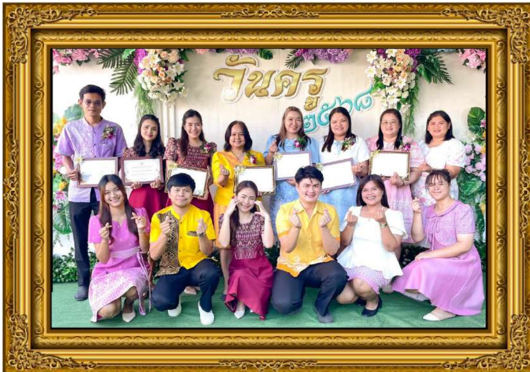
ภาพที่ ๔ ผู้บริหารและครู ได้รับรางวัลข้าราชการครูและบุคลากรทางการศึกษาดีเด่น ปีการศึกษา ๒๕๖๘