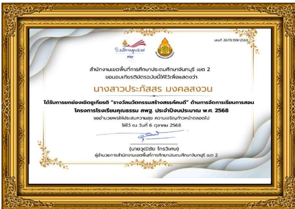
ภาพที่ ๑๘ ผู้บริหารและคณะครูได้รับรางวัลนวัตกรรมสร้างสรรค์คนดี ด้านการจัดการเรียนการสอน โครงการโรงเรียนคุณธรรม สพฐ. ประจำปีงบประมาณ พ.ศ. ๒๕๖๘