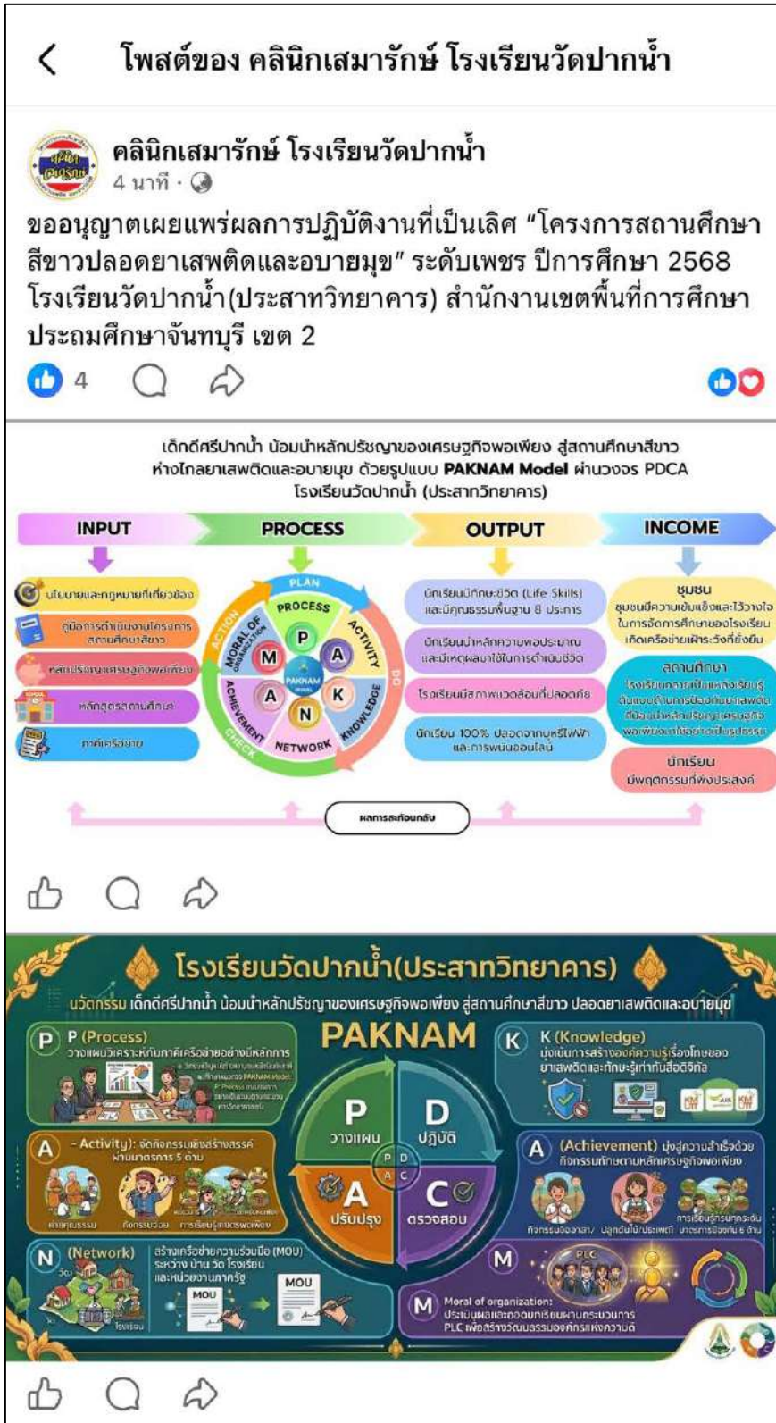
เผยแพร่ผ่าน Facebook คลินิกเสมารักษ์ โรงเรียนวัดปากน้ำ