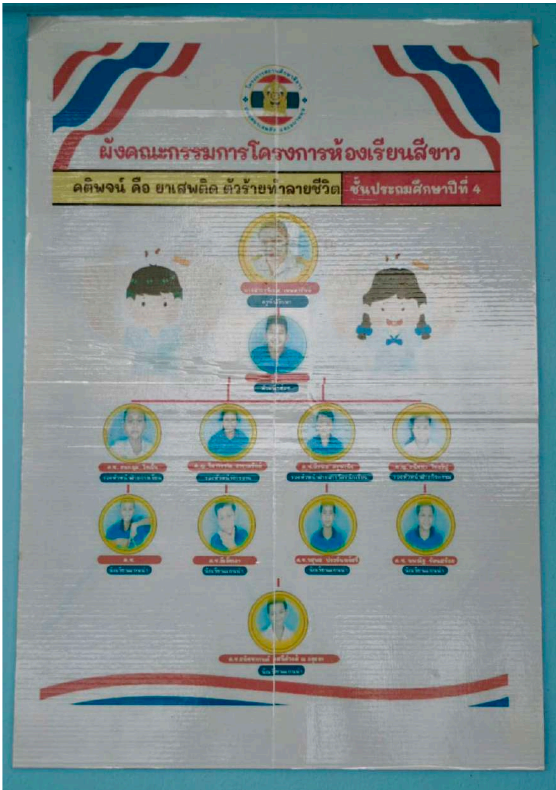
โครงสร้างห้องเรียนสีขาวชั้นประถมศึกษาปีที่ ๔