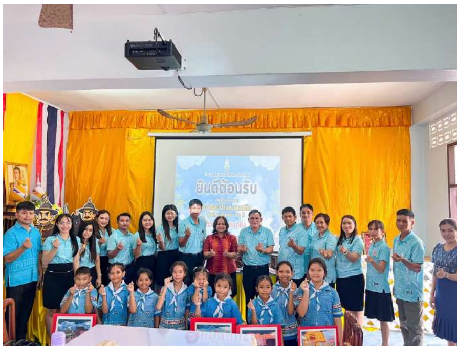
รูปภาพ การศึกษาดูงานจากผู้บริหารและคณะครูโรงเรียนบ้านหนองสทิต