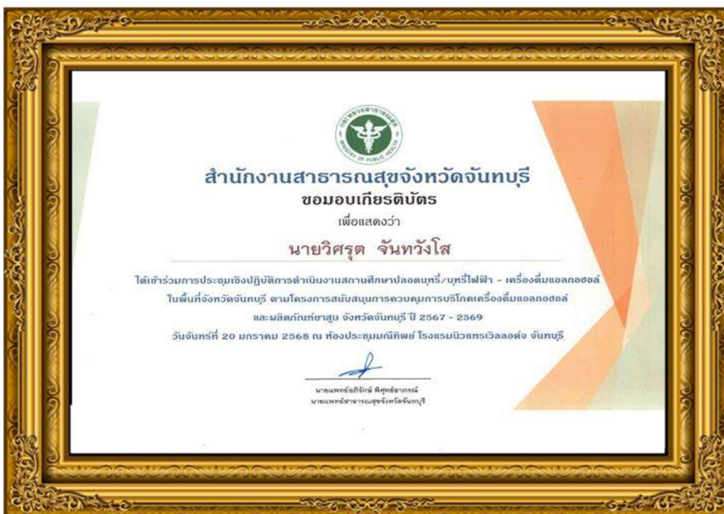
ภาพที่ ๑๔ ครูได้เข้าร่วมการประชุมเชิงปฏิบัติการดำเนินงานสถานศึกษาปลอดภัย/บุรีไฟฟ้า - เครื่องดื่ม แอลกอฮอล์ ในพื้นที่จังหวัดจันทบุรี ตามโครงการสนับสนุนการควบคุมการบริโภคเครื่องดื่มแอลกอฮอล์ และผลิตภัณฑ์ยาสูบ จังหวัดจันทบุรี ปี ๒๕๖๗ - ๒๕๖๙