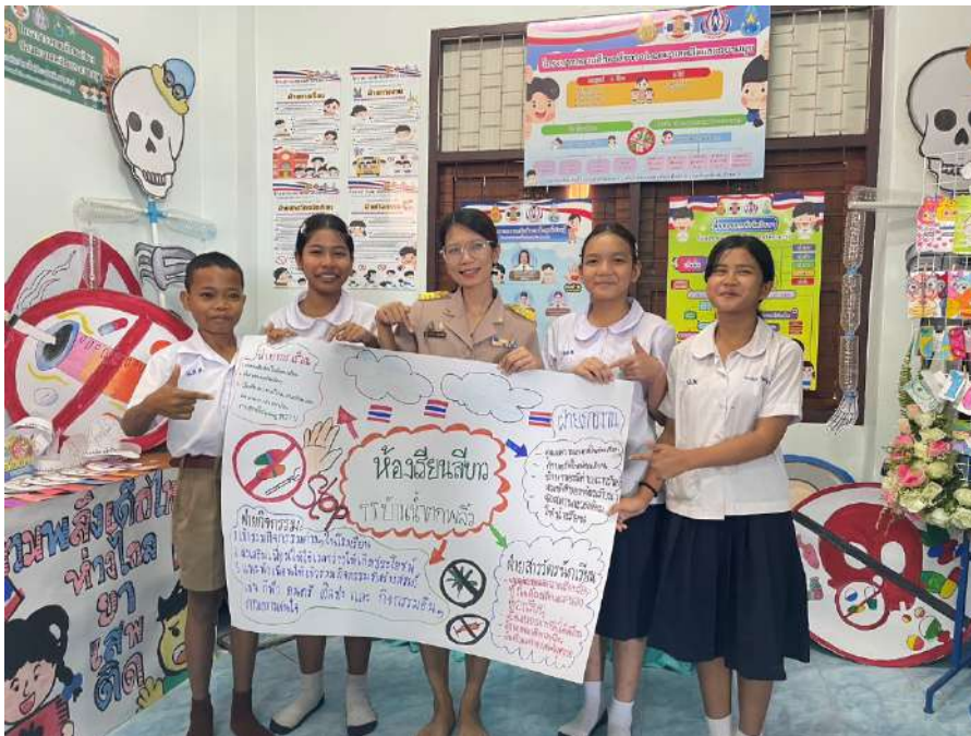
รูปภาพ การจัดนิทรรศการเผยแพร่ผลงานการดำเนินงานกิจกรรมโครงการสถานศึกษาสีขาว