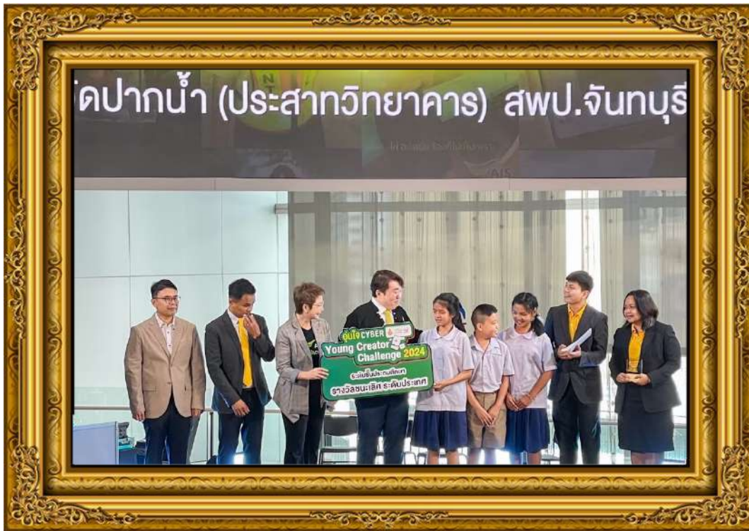
ภาพที่ ๕ นักเรียนได้รับรางวัลชนะเลิศระดับประเทศ การประกวดคลิปวิดีโอสุขภาพดิจิทัล “อุ่นใจไซเบอร์ YoungCreatorChallenge ๒๐๒๔”