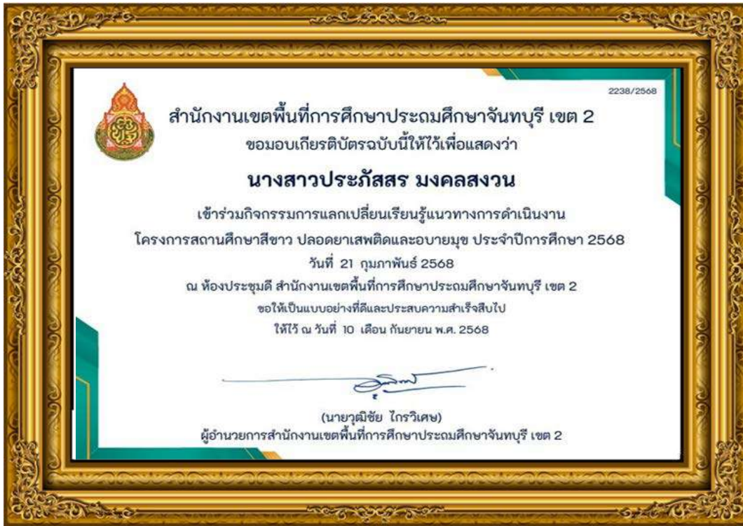
ภาพที่ ๑๗ คณะครูร่วมกิจกรรมการแลกเปลี่ยนเรียนรู้แนวทางการดำเนินงานโครงการสถานศึกษาสีขาว ปลอดภัยเสถียรและอบายมุข ประจำปีการศึกษา ๒๕๖๘