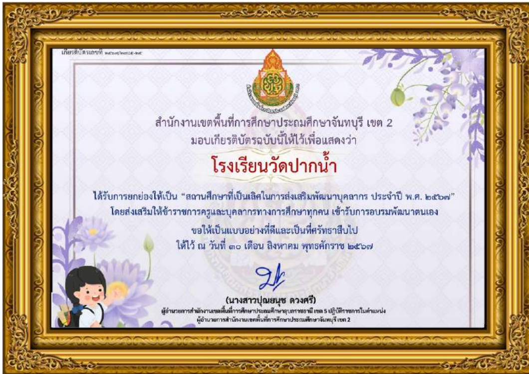
ภาพที่ ๑๑ โรงเรียนวัดปากน้ำได้รับการยกย่องให้เป็น สถานศึกษาที่เป็นเลิศในการส่งเสริมพัฒนาบุคลากร ประจำปี พ.ศ. ๒๕๖๗