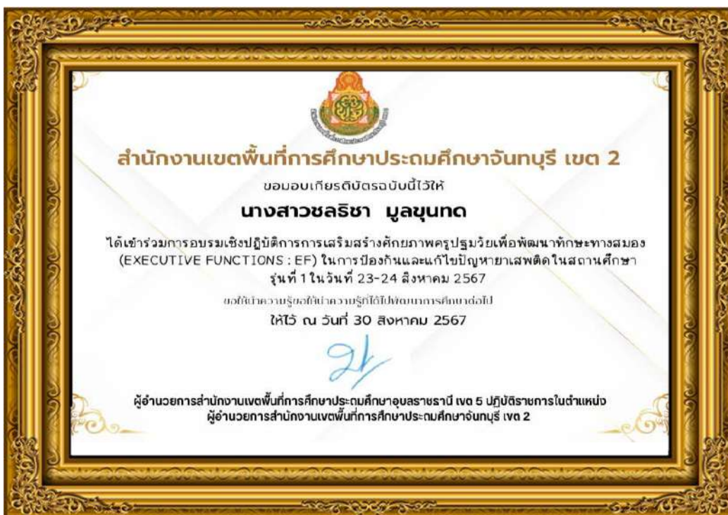
ภาพที่ ๑๒ ผู้บริหารและคณะครูได้เข้าร่วมการอบรมเชิงปฏิบัติการการเสริมสร้างศักยภาพครูปฐมวัย เพื่อพัฒนาทักษะทางสมอง (Executive Functions:EF) ในการป้องกันและแก้ไขปัญหาเสพติด ในสถานศึกษา