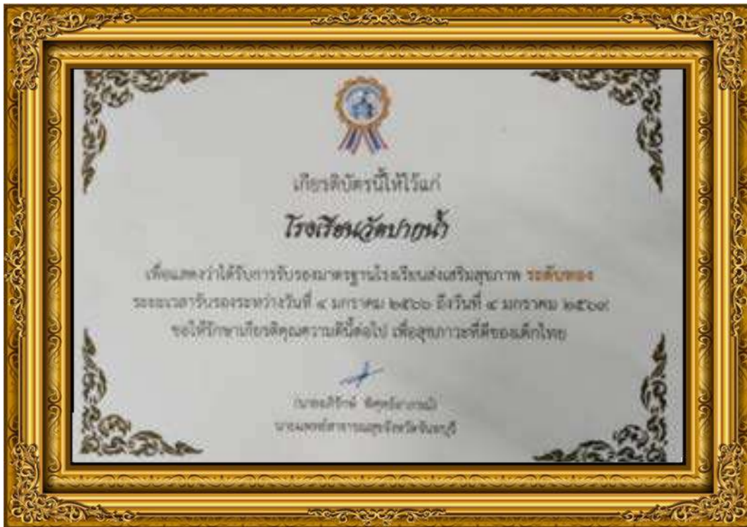
ภาพที่ ๗ โรงเรียนวัดปากน้ำ (ประชาวิทยาคาร) ได้รับรางวัลโรงเรียนส่งเสริมสุขภาพระดับทอง จากสาธารณสุขจังหวัดบุรีรัมย์ ปีการศึกษา ๒๕๖๖-๒๕๖๗