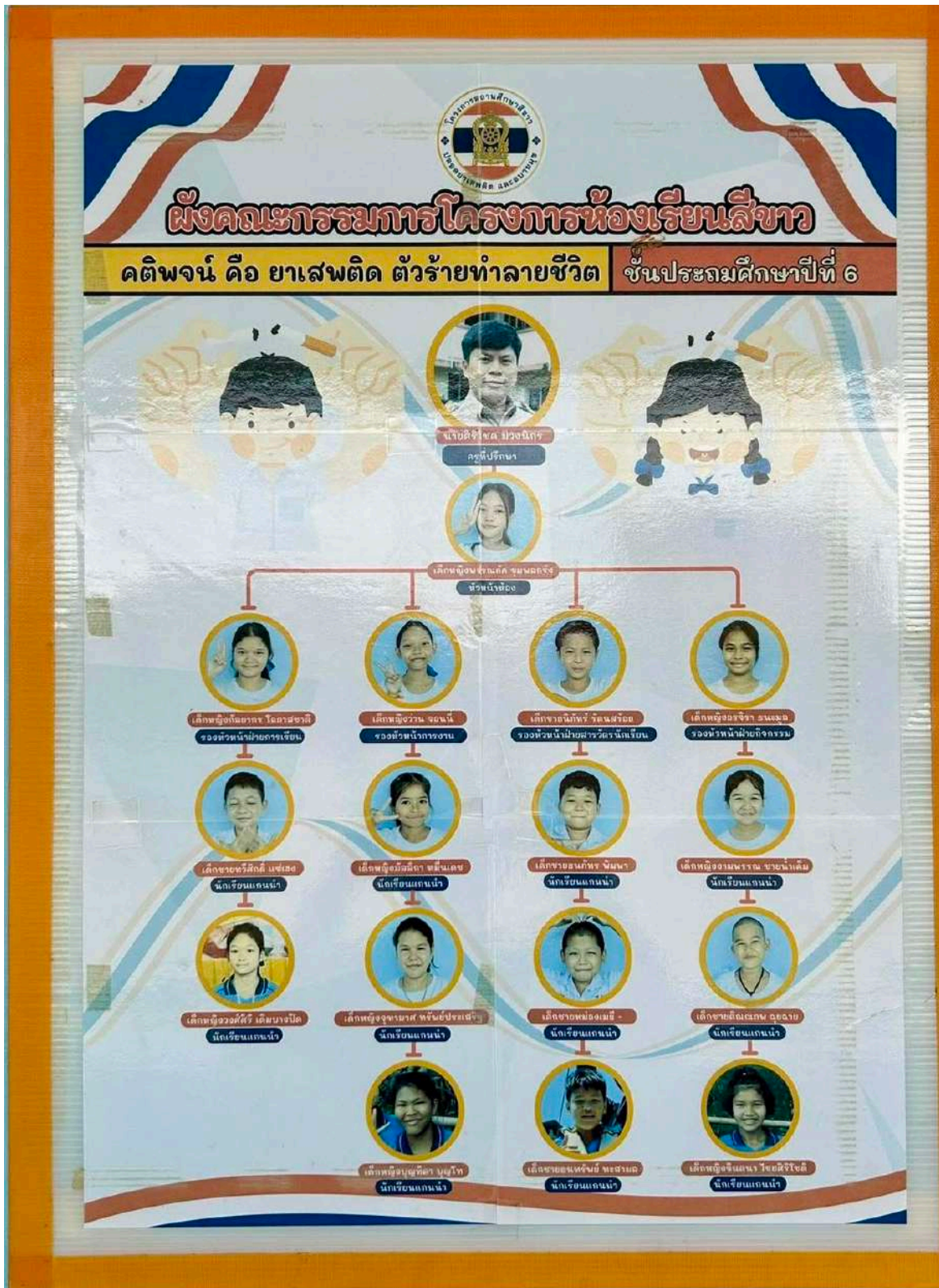
โครงสร้างห้องเรียนสีขาวชั้นประถมศึกษาปีที่ ๖