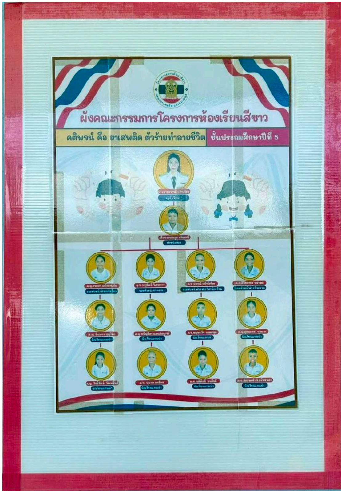
โครงสร้างห้องเรียนสีขาวชั้นประถมศึกษาปีที่ ๕