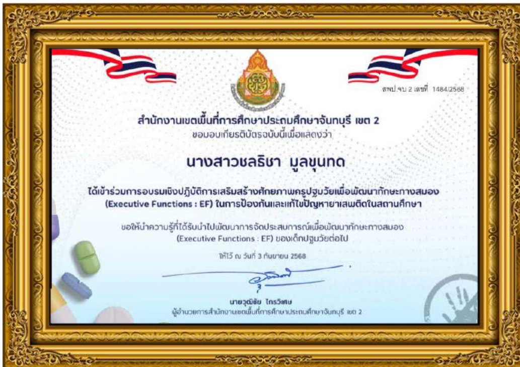
ภาพที่ ๑๖ คณะครูเข้าร่วมการอบรมเชิงปฏิบัติการเสริมสร้างศักยภาพครูปฐมวัยเพื่อพัฒนาทักษะทางสมอง (Executive Functions : EF) ในการป้องกันและแก้ไขปัญหายาเสพติดในสถานศึกษา