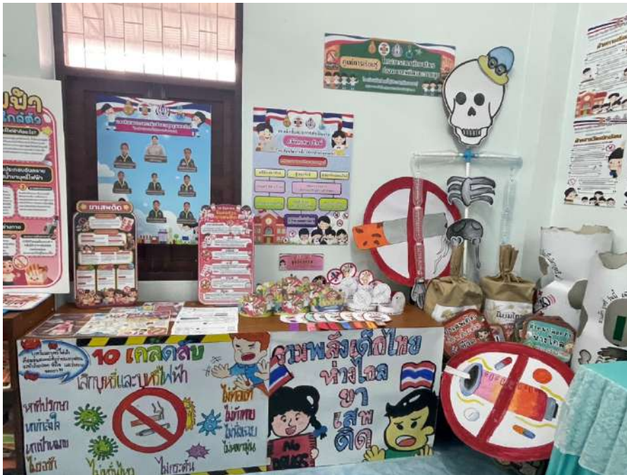
รูปภาพ การจัดนิทรรศการเผยแพร่ผลงานการดำเนินงานกิจกรรมโครงการสถานศึกษาสีขาว

เผยแพร่โดยการจัดนิทรรศการเผยแพร่ผลงานการดำเนินงานกิจกรรมโครงการสถานศึกษาสีขาว เพื่อให้โรงเรียนในเครือข่ายได้ศึกษาดูงาน