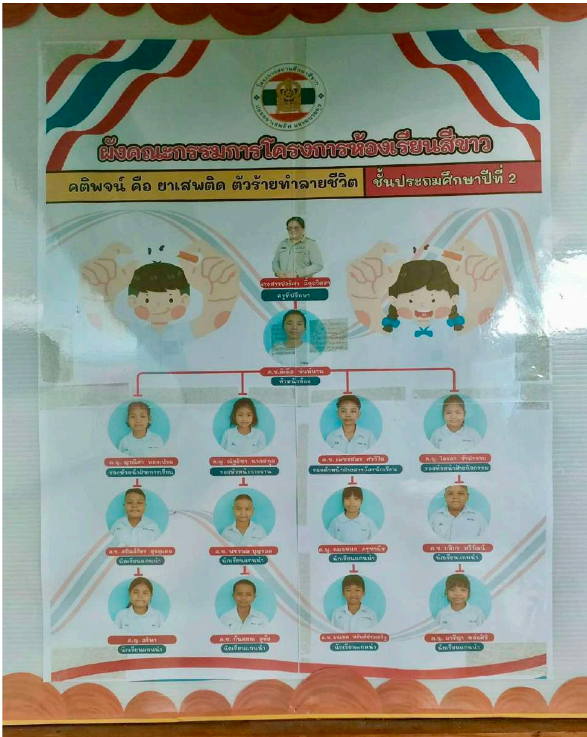
โครงสร้างห้องเรียนสีขาวชั้นประถมศึกษาปีที่ ๒