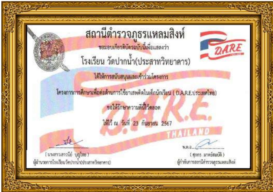
ภาพที่ ๙ โครงการการศึกษาเพื่อต่อต้านการใช้ยาเสพติดในเด็กนักเรียน (D.A.R.E ประเทศไทย)