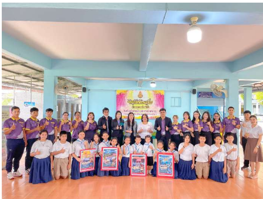
รูปภาพ การศึกษาดูงานจากผู้บริหารและคณะครูโรงเรียนบ้านบ่อนางซิง