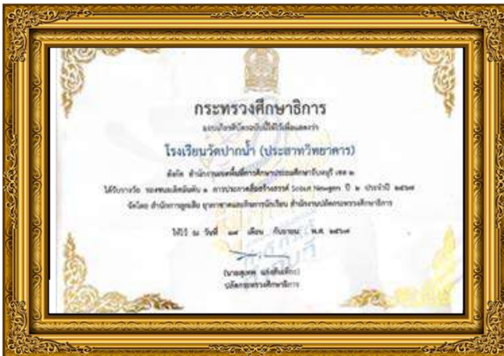
ภาพที่ ๑๐ โรงเรียนวัดปากน้ำ (ประสาทวิทยาคาร) ได้รับรางวัลรองชนะเลิศอันดับ ๑ การประกวดสื่อสร้างสรรค์ Scout Newgen ปี ๒ ประจำปี ๒๕๖๗