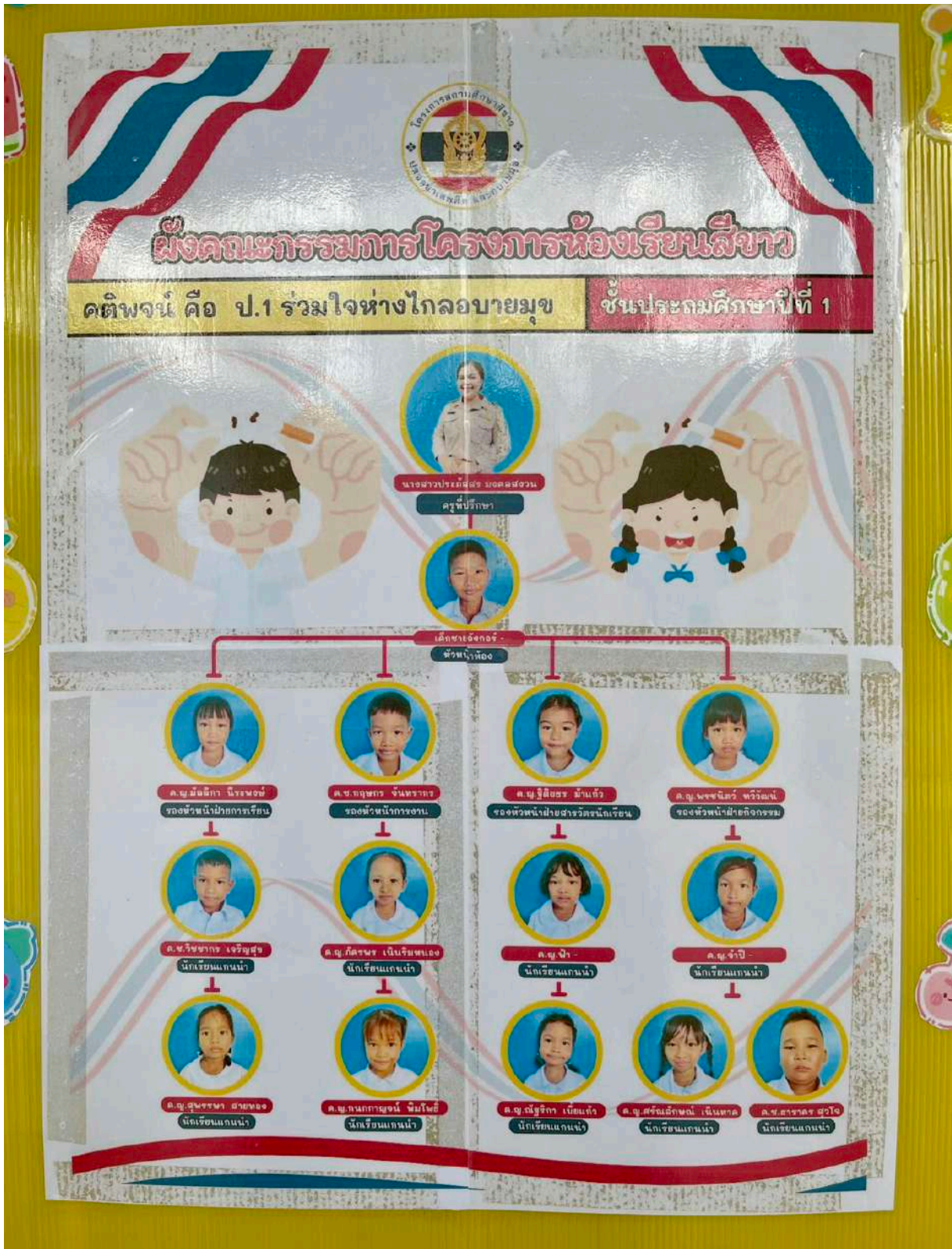
โครงสร้างห้องเรียนสีขาวชั้นประถมศึกษาปีที่ ๑