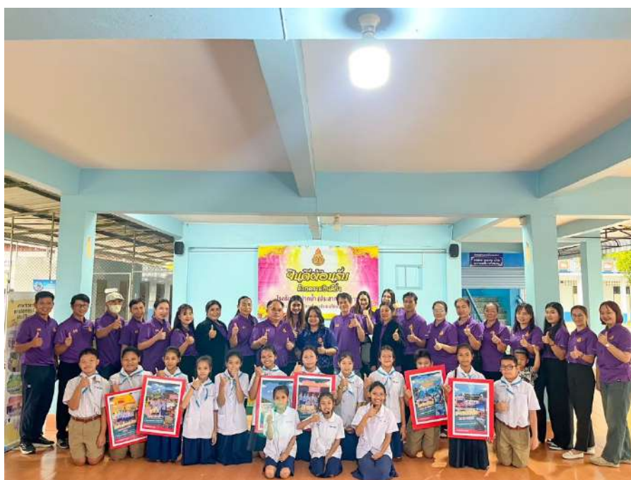
รูปภาพ การศึกษาดูงานจากผู้บริหารและคณะครูโรงเรียนบ้านไร่ณาเดียว