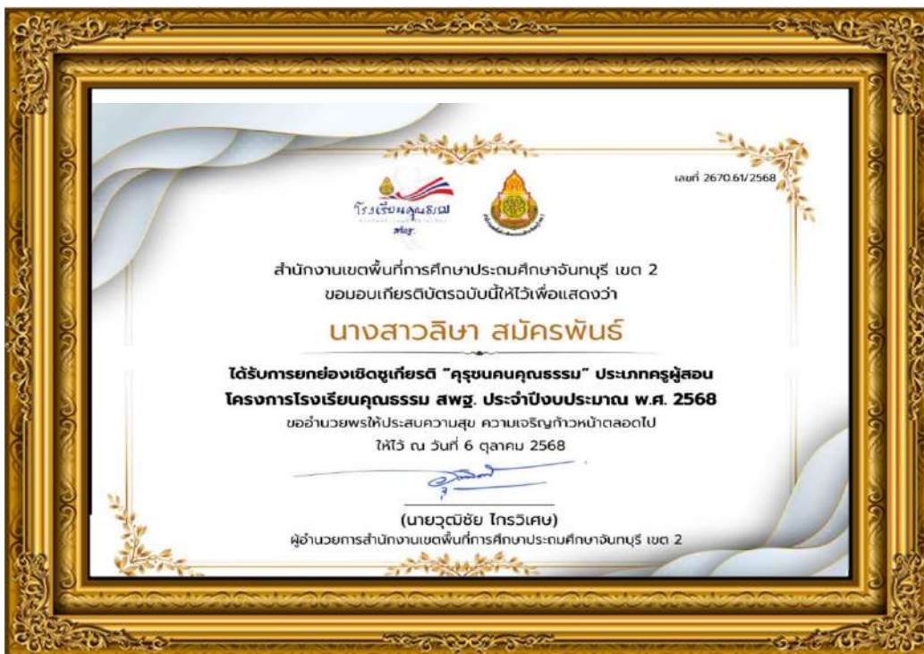
ภาพที่ ๒๑ รางวัลครูชนคนคุณธรรม ประเภทผู้บริหาร และครูผู้สอน โครงการโรงเรียนคุณธรรม สพฐ. ประจำปีงบประมาณ พ.ศ. ๒๕๖๘