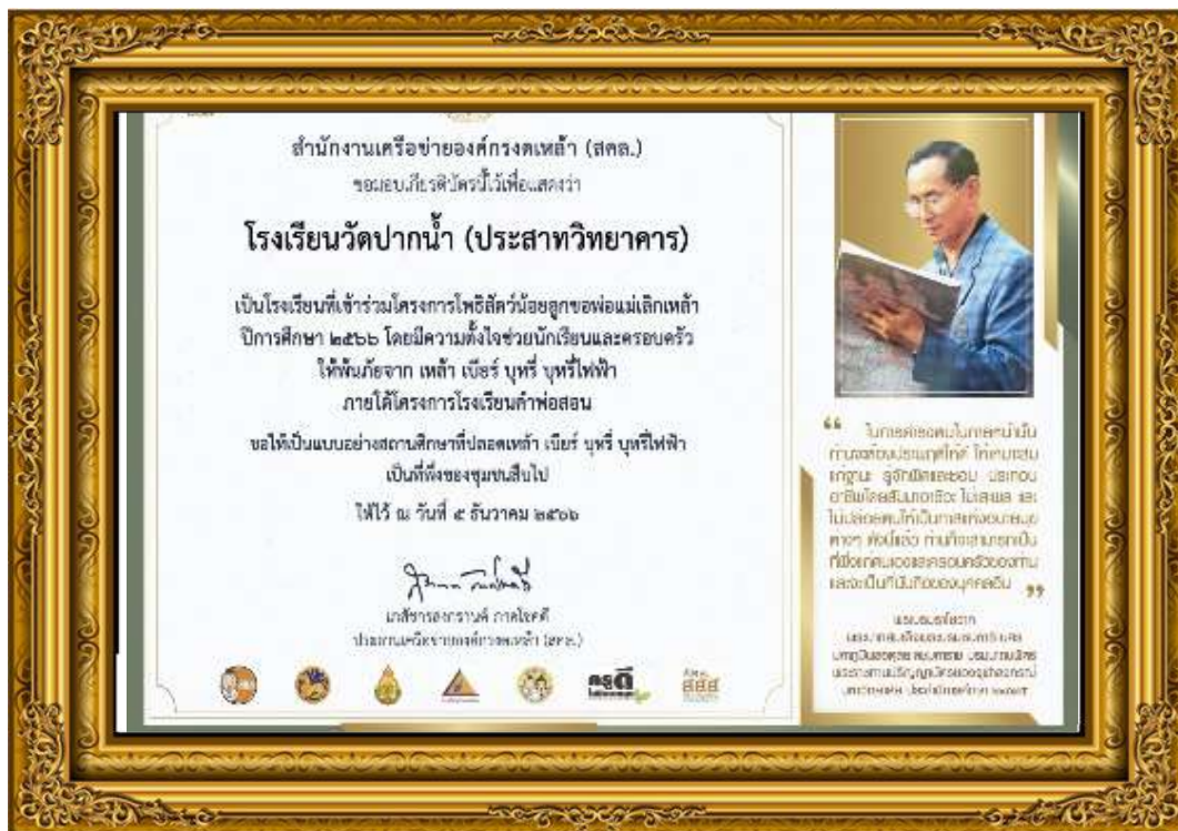
ภาพที่ ๖ โรงเรียนวัดปากน้ำ (ประชาวิทยาคาร) เป็นโรงเรียนที่เข้าร่วมโครงการโพธิสัตว์น้อย ลูกขอพ่อแม่เล็กเหล่า ปีกการศึกษา ๒๕๖๖ โดยมีความตั้งใจช่วยนักเรียนและครอบครัวให้พ้นภัยจาก เหล้า เบียร์ บุหรี่ บุหรี่ไฟฟ้า ภายใต้โครงการโรงเรียนคำพ่อสอน