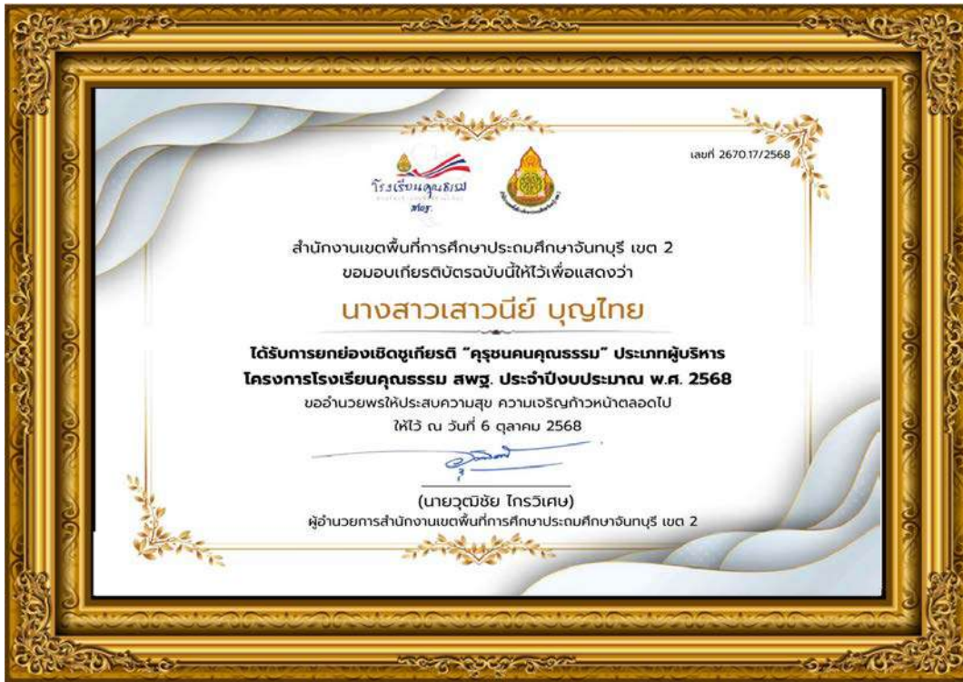
ภาพที่ ๒๐ รางวัลครูชนคนคุณธรรม ประเภทผู้บริหาร และครูผู้สอน โครงการโรงเรียนคุณธรรม สพฐ. ประจำปีงบประมาณ พ.ศ. ๒๕๖๘