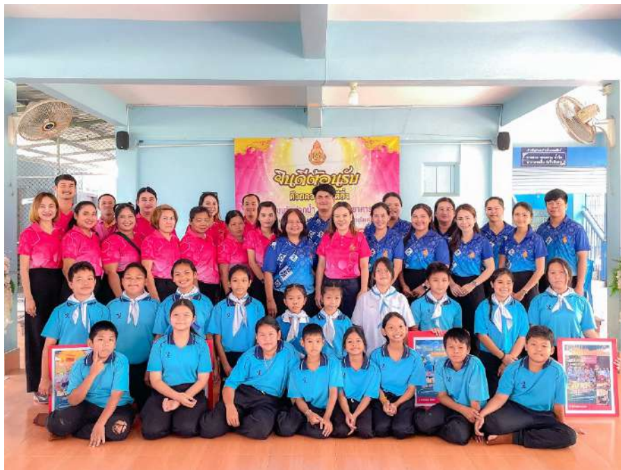
รูปภาพ การศึกษาดูงานจากผู้บริหารและคณะครูโรงเรียนบ้านเขาแก้ว

ผลสำเร็จจากการมุ่งมั่นดำเนินงานอย่างเป็นระบบ ส่งผลให้โรงเรียนวัดปากน้ำ (ประสาทวิทยาคาร) ได้รับความเชื่อมั่นและประจักษ์ในผลงาน จนได้รับการยอมรับให้เป็นสถานศึกษาต้นแบบจากหน่วยงาน องค์กร และสถานศึกษาต่าง ๆ ดังนี้