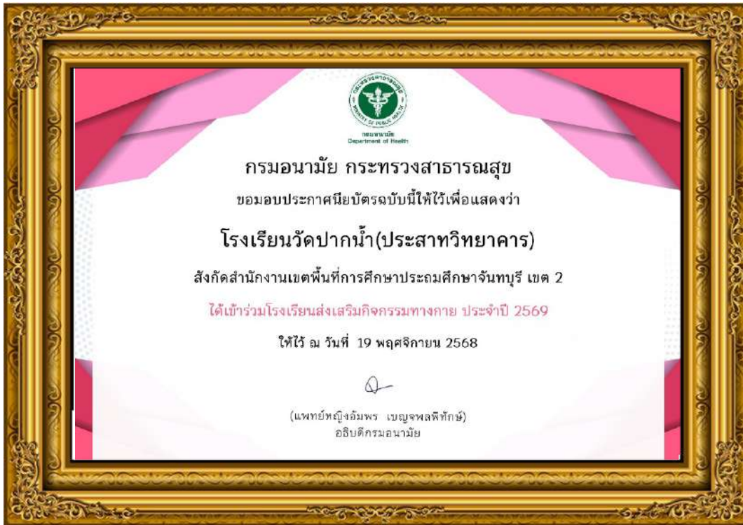
ภาพที่ ๑๙ โรงเรียนวัดปากน้ำได้เข้าร่วมโรงเรียนส่งเสริมกิจกรรมทางกาย ประจำปี ๒๕๖๙