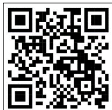
SLP PLODPAI Safety Model

โรงเรียนศาลาพัน ดำเนินการด้านความปลอดภัยในสถานศึกษา พร้อมทั้งจัดทำ (Best Practices) รูปแบบ SLP PLODPAI Safety Model และ SAFE Theater Mode