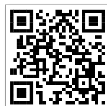
SAFE Theater Model