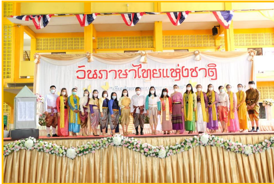
กิจกรรมวันภาษาไทย