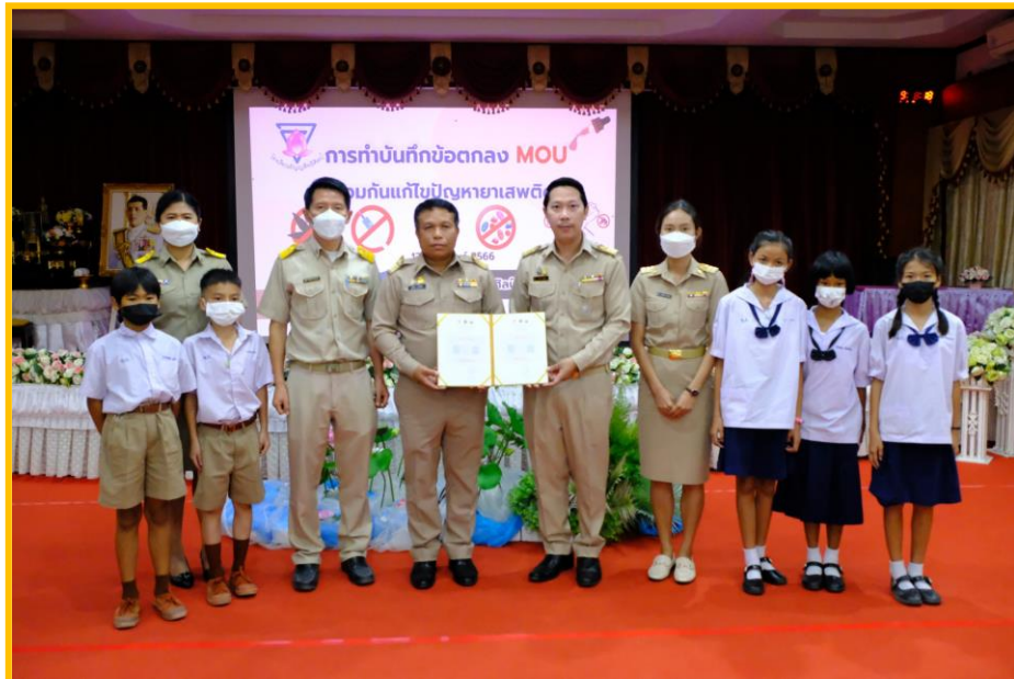
โครงการโรงเรียนสีขาว