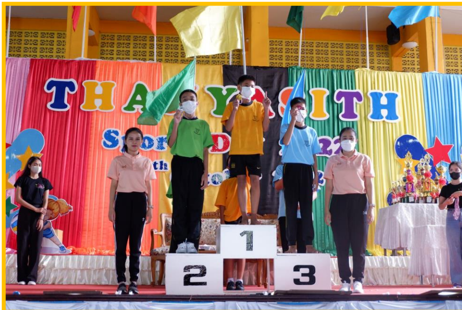
กิจกรรมกีฬา