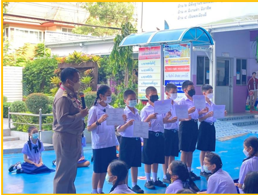
โครงการส่งเสริมความเป็นเลิศทางวิชาการ