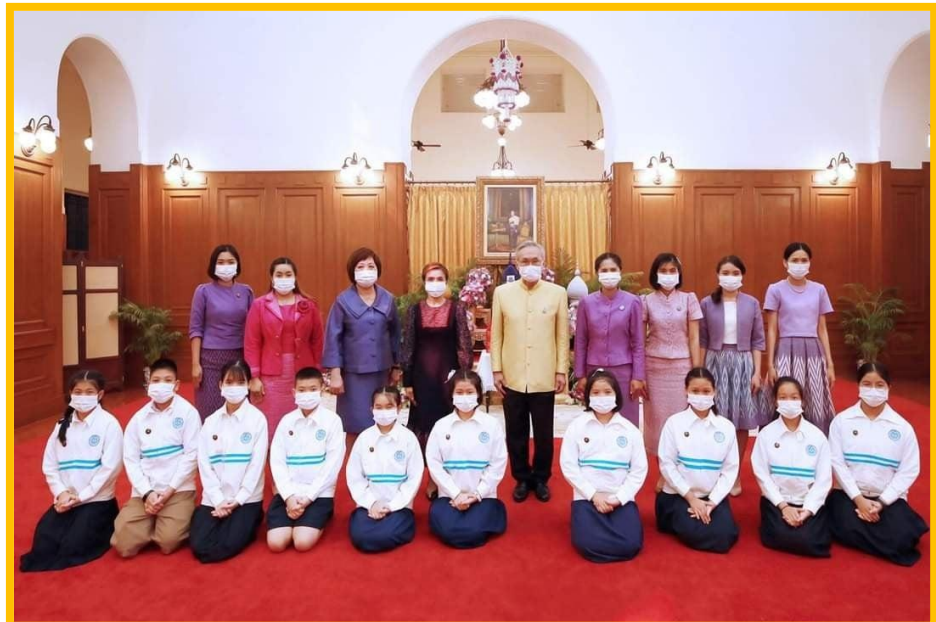
โครงการยวทูตความดี