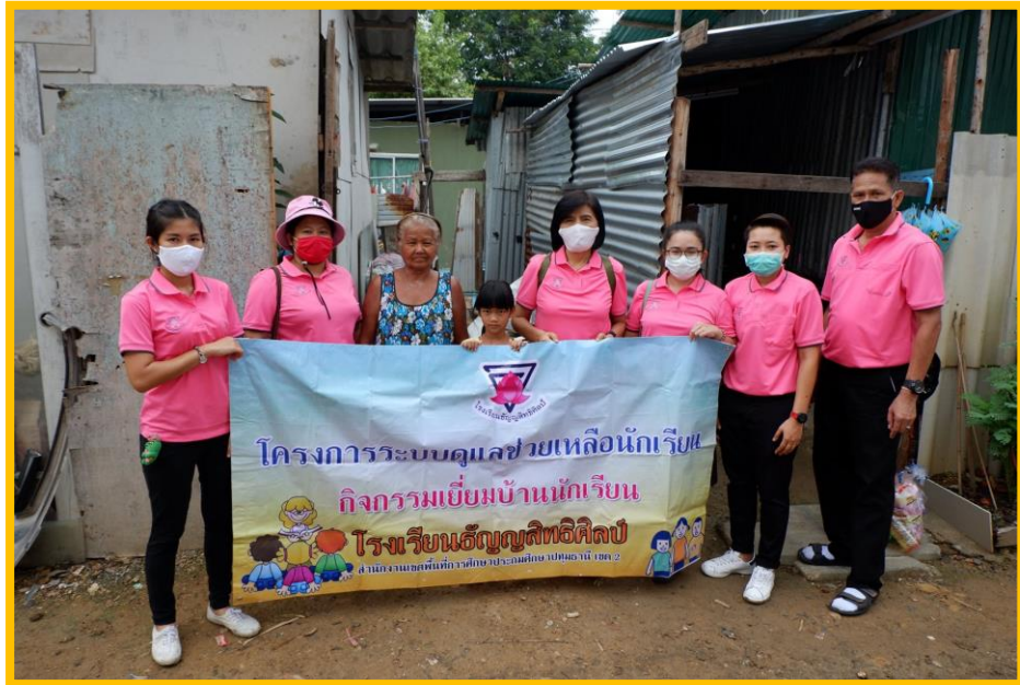
โครงการระบบดูแลและช่วยเหลือนักเรียน